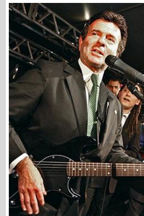
LUIZ FUX Ministro STF