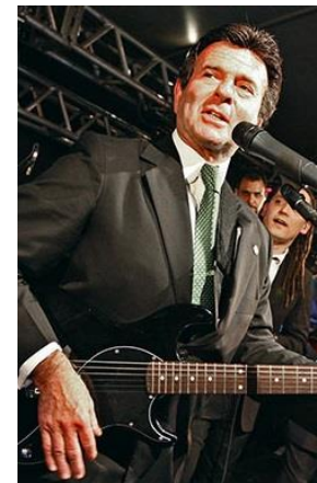
LUIZ FUX Ministro STF

O conceito de prestação de serviços não teria, portanto, por premissa a configuração dada pelo Direito Civil. Seria, por outro lado, relacionado ao oferecimento de uma utilidade para outrem , a partir de um conjunto de atividades imateriais, prestados com habitualidade e intuito de lucro, podendo estar conjugada ou não com a entrega de bens ao tomador. Outrossim, e tendo em conta as premissas expostas, a natureza jurídica securitária alegada pelas operadoras de “planos de saúde” para infirmar a incidência do ISS não indicaria fundamento capaz de afastar a cobrança do tributo no caso em comento . Isso se daria porque, diferentemente dos “seguros-saúde”, nos “planos de saúde” a garantia oferecida seria tão somente a utilidade obtida mediante a contratação do respectivo plano, o que não excluiria o fato de as atividades por elas desempenhadas — operadoras de plano de saúde e operadoras de seguro-saúde — serem “serviço”. Nesse sentido, o ISS deveria incidir sobre a comissão, assim considerada a receita auferida sobre a diferença entre o valor recebido pelo contratante e o que repassado para os terceiros prestadores dos serviços médicos. Em seguida, pediu vista dos autos o Ministro Marco Aurélio.