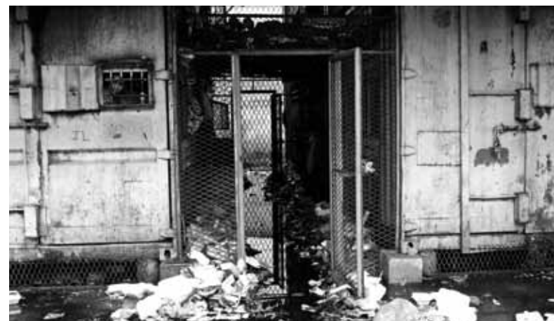
Contêineres utilizados como celas para abrigar presos Delegacia de Novo Horizonte – abril/2009