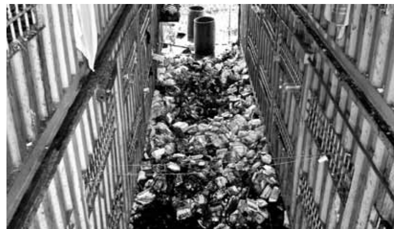
Lixo acumulado entre as celas metálicas Delegacia de Novo Horizonte – abril/2009