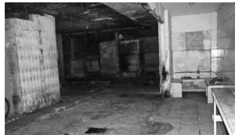
Local onde havia cela superlotada. Delegacia de Polícia Judiciária de Vila Velha – abril/2011