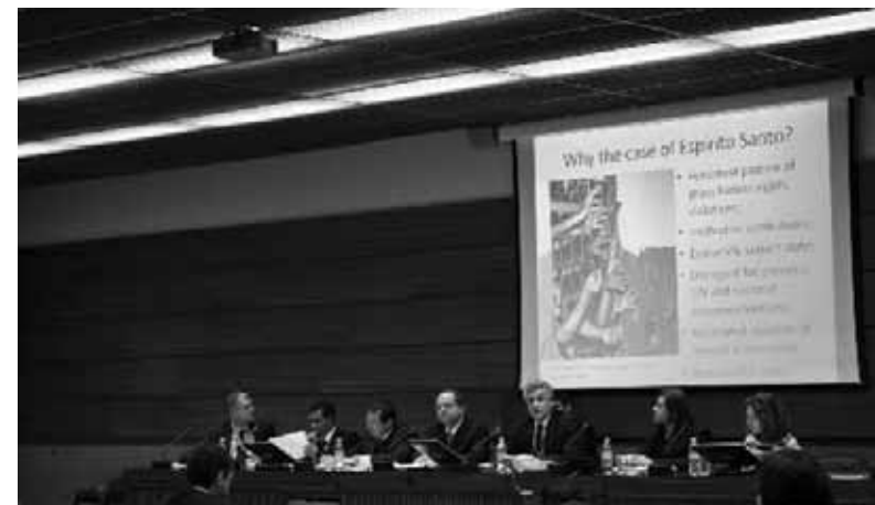
Situação do sistema prisional do Espírito Santo é exposta em evento paralelo no Conselho de Direitos Humanos da ONU em Genebra (Suíça), março/2010.

As graves e sistemáticas violações de direitos humanos nos presídios do Espírito Santo foram expostas para um público de cerca de 100 representantes de delegações diplomáticas, da ONU e de ONGs de vários países.