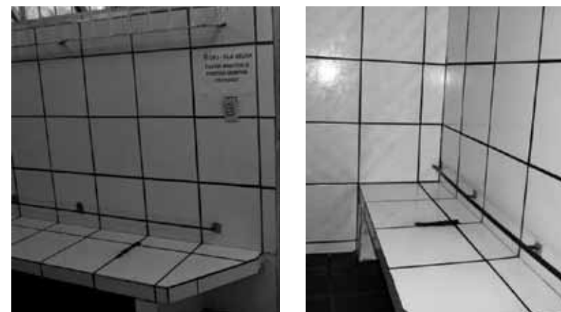
Banco da recepção do DPJ de Vila Velha, onde presos algemados à barra de ferro aguardam transferências aos finais de semana. Delegacia de Polícia Judiciária de Vila Velha – abril/2011.