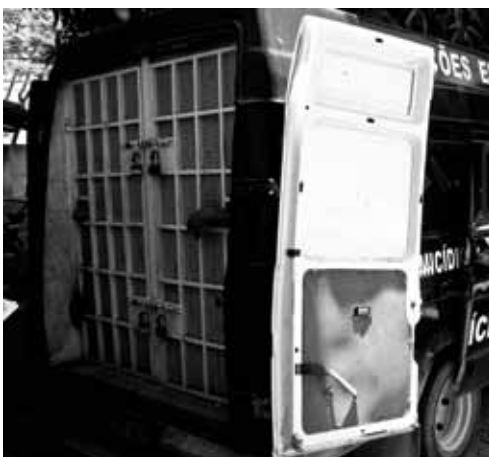
Microônibus usado como cela para abrigar detentos Delegacia de Homicídios de Vitória – fevereiro/2010