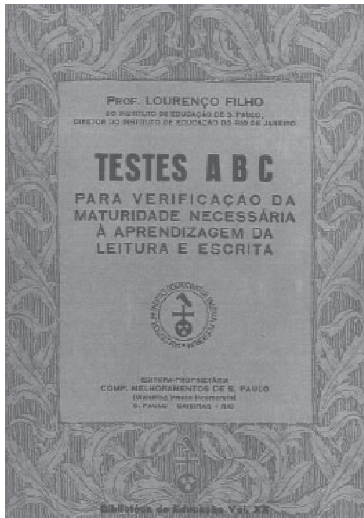
Cópia fac-similar da capa de Testes ABC , de Lourenço Filho, da coleção Biblioteca da Educação, da Melhoramentos.