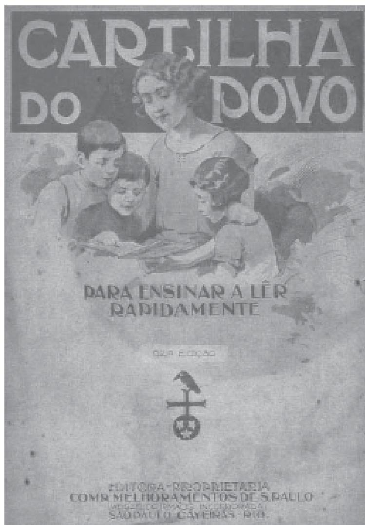
Cartilha do povo , aqui em cópia fac-similar de sua 62ª edição.