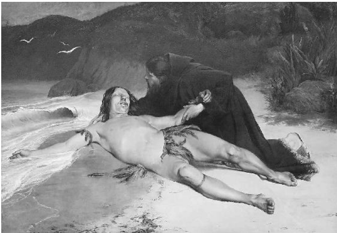
Rodolfo Amoedo, O último tamoio, 1883, Museu Nacional de Belas Artes.

indígena praticamente sem vida, sendo velado por um jesuíta, o próprio José de Anchieta (inexplicavelmente trajado como franciscano), que acompanha sua morte lenta e tranquila. A morte representa a derradeira submissão do bravo guerreiro. Os trópicos ambientam a cena, devidamente edenizada, e não há traços de violência ou arbítrio. Ao contrário, a América parece se curvar diante da Europa e assim fundar uma nova nação, a partir do “sacrifício voluntário” e dadivoso de seus naturais.