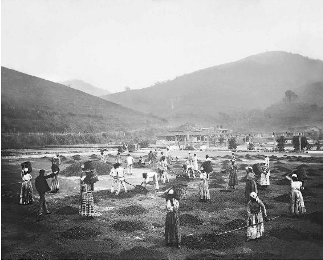
Marc Ferrez, Escravos em terreiro de uma fazenda de café na região do Vale do Paraíba. São Paulo. 30 × 40 cm. Acervo Instituto Moreira Salles.