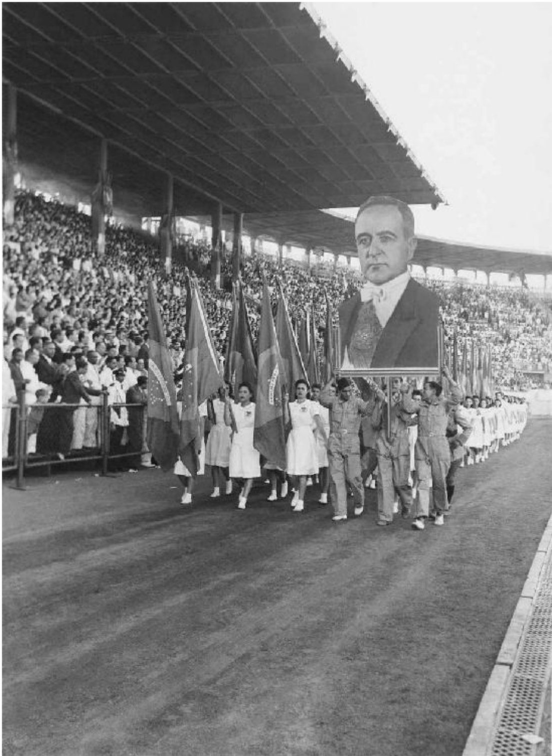
Fotógrafo não identificado, Primeiro de maio de 1942 no Campo do Vasco, Rio de Janeiro, 1942. Gelatina/prata. Acervo Iconographia.