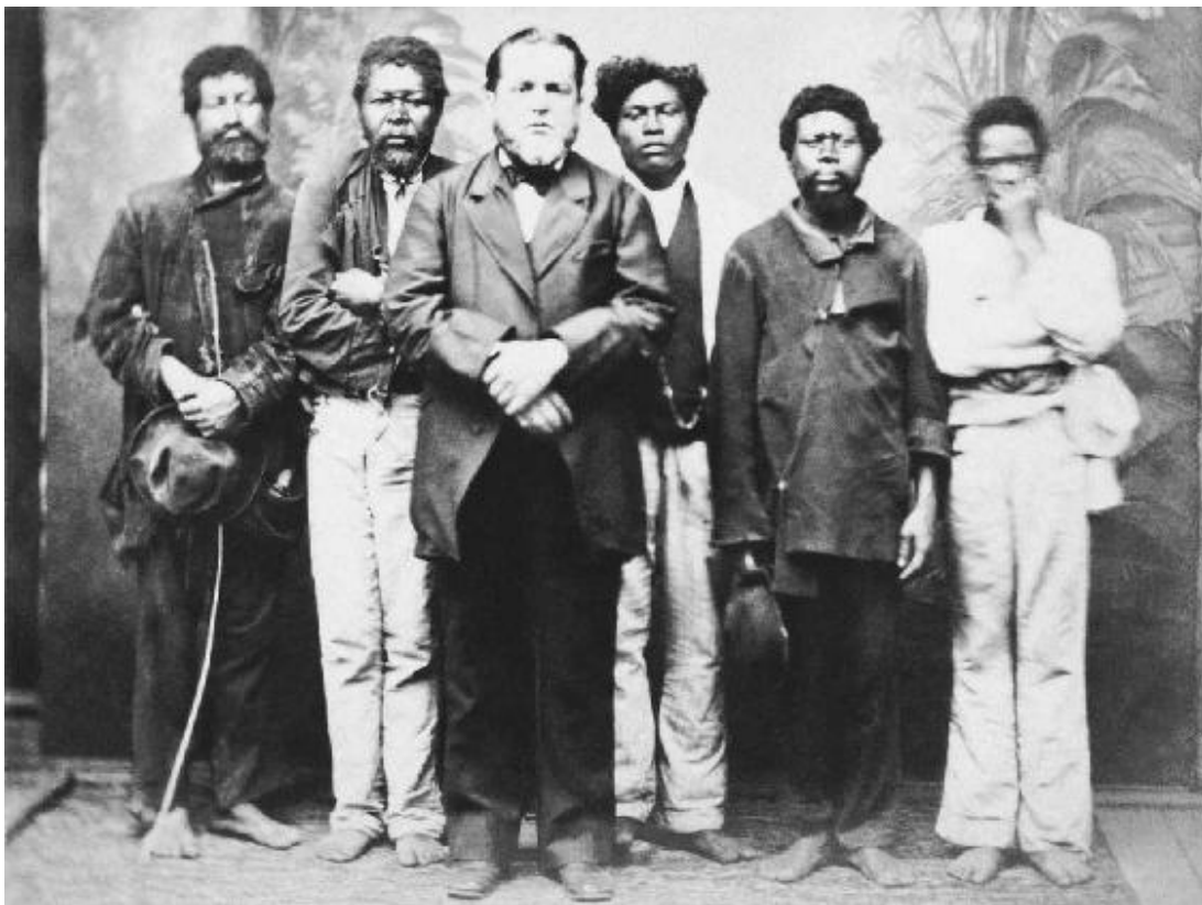
Senhor e seus escravos, São Paulo, albúmen de Militão Augusto de Azevedo, c. 1860. 6,3 × 8,3 cm. Museu Paulista da Universidade de São Paulo.

Marc Ferrez (1843-1923), um dos grandes pioneiros da fotografia no Brasil e profissional de rara qualidade e capacidade, elaborou um belo álbum de fotos para apresentar as fazendas e plantações de café do Vale do Paraíba. As paisagens são amplas, muito organizadas, e nelas os trabalhadores dedicam-se pacífica e dádivosamente às suas tarefas diárias. Os cativos surgem dispostos de maneira geométrica e sempre olhando para baixo. Esses são gestos e atitudes, como veremos, especialmente arquitetados pelo fotógrafo, que procurava não apenas corroborar como difundir a imagem de uma hierarquia inflexível, em que os trabalhadores são passivos e não mostram nenhum laivo de reação. Hoje sabemos,