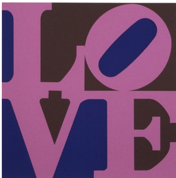
Fig. 4: Robert Indiana (n. 1928), LOVE , 1966. Óleo sobre tela, 72 x 72 cm. Indianapolis Museum of Art. Cf. Prancha 1, p. 377