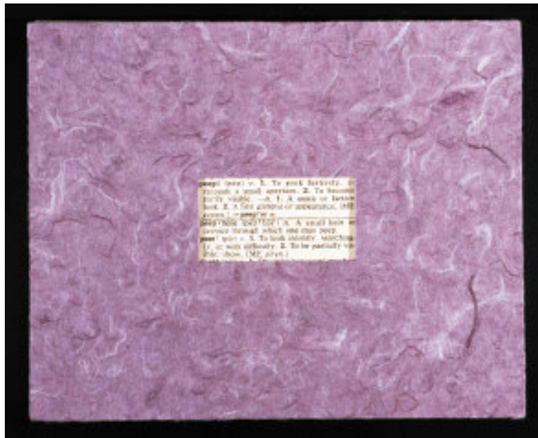
Fig. 1a: Vista de cima.