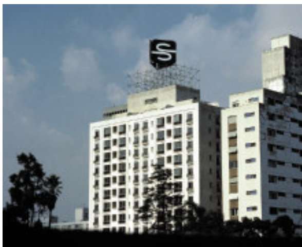
Fig. 2: Logotipo da construtora “Sobloco” no topo de um prédio em São Paulo, 1980.

Esse signo parece ser uma letra, mas não pertence a nenhum sistema de fontes vigente. A maioria dos transeuntes vai lê-lo, todavia, sem esforço como um S, pois sabe que representa a firma Sobloco. Ele é formado pela combinação de um signo visual e de sua inversão, que, nesse contexto, representa visualmente o extremo curvado das vigas de ferro, utilizadas na construção de edifícios. O texto consiste, portanto, de uma dupla sinédoque: a letra inicial aponta para o nome completo da firma 25 e a linha curva, como signo icônico, para uma parte do material de construção que, afinal, representa a obra toda. Extraído do contexto apropriado, o minitexto perde sua identidade midiática: ele não tem, para usarmos a terminologia de Peirce, nem caráter claramente simbólico, nem claramente icônico. Aqueles que encontram o signo fora do contexto não irão necessariamente lê-lo como um S (portanto, como uma letra). E, quando até mesmo um leitor acostumado a métodos modernos de design procurar entender o signo como logotipo, ele pode simplesmente não considerar a possibilidade de que as linhas curvas possam pertencer a outro sistema sígnico. Dentro do contexto da publicidade da construtora, porém, a mensagem verbovisual do logotipo está clara e efetiva. Note-se que seu efeito resulta da fusão indissolúvel de signos que pertencem a dois sistemas sígnicos diferentes: sem valer como letra, as linhas curvas perdem também sentido e função enquanto signos icônicos.