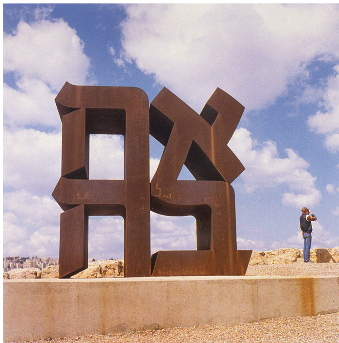
Fig. 7: Robert Indiana, AHAVA , 1977. Aço Corten, 3,66 x 3,66 x 1,83 m. Jerusalém: The Israel Museum. Cf. Prancha 2, p. 377

intermediática, em que a mudança de uma língua para outra requer a permuta (novamente favorecida pelo acaso) de signos escritos de dois sistemas dentro da mesma estrutura sígnica, sendo que o traço mais característico do texto-fonte, o O inclinado, 31 é substituído pela cursividade da letra hebraica que ocupa o lugar correspondente, aparentemente tratando-se de uma equivalência.