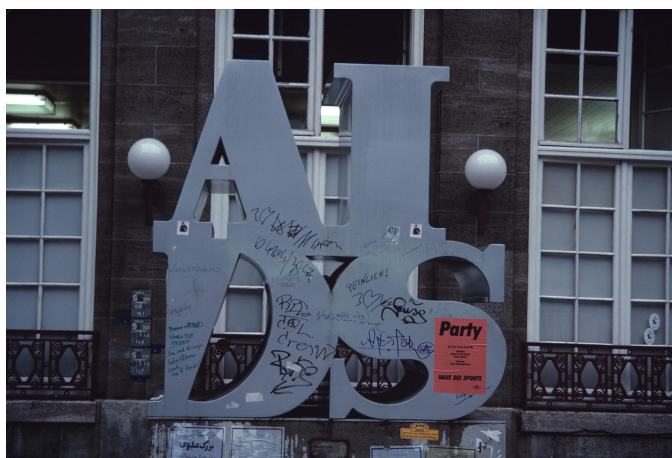
Fig. 6: AIDS . Escultura de metal de General Idea (Toronto), exposta temporariamente na Spitalerstraße, em Hamburgo, 1990.

A escultura AIDS (Fig. 6) obtém todo o seu efeito por sua referência ao logotipo de Indiana; assim, ela só pode ser compreendida enquanto citação, que é bastante evidente, principalmente quando se observa a ordem das quatro letras, em que o I no quadrante direito superior não atinge a borda, exatamente como o O na obra de Robert Indiana. Mas o I atua esteticamente de maneira bastante insatisfatória e mal conseguimos imaginá-lo inclinado como o O – uma conclusão a que chegamos apenas porque tentamos essa idéia como construção de variantes. Entretanto, o procedimento de inclinar a letra é citado em outro lugar, isto é, no espaço interno do D, cuja forma é alterada, o que se justifica, novamente, apenas pela referência a LOVE . Vemos AIDS e lemos LOVE ; mas AIDS é feia. Exceto pelo fato de se tratar, em ambos os casos, de palavras de quatro letras, a intertextualidade desse texto intermídia se baseia nos signos visuais; contudo, sem o significado dos signos verbais, o todo não faria nenhum sentido.