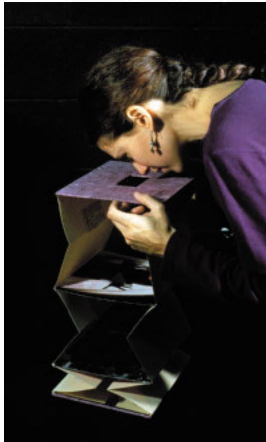
Fig. 1b: A artista lendo o livro.