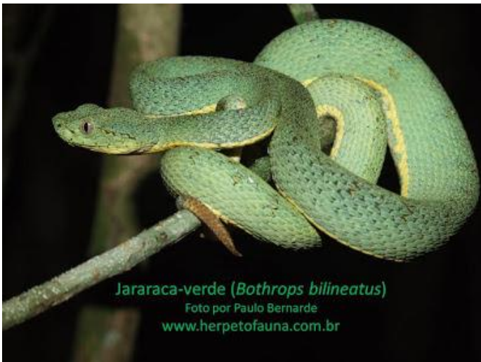
Jararaca-verde ( Bothrops bilineatus )