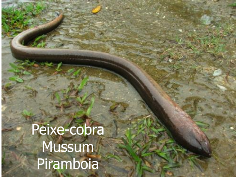
Peixe-cobra Mussum Piramboia

http://media.tumblr.com/tumblr_idkukr4qbz1qb6w5w.jpg