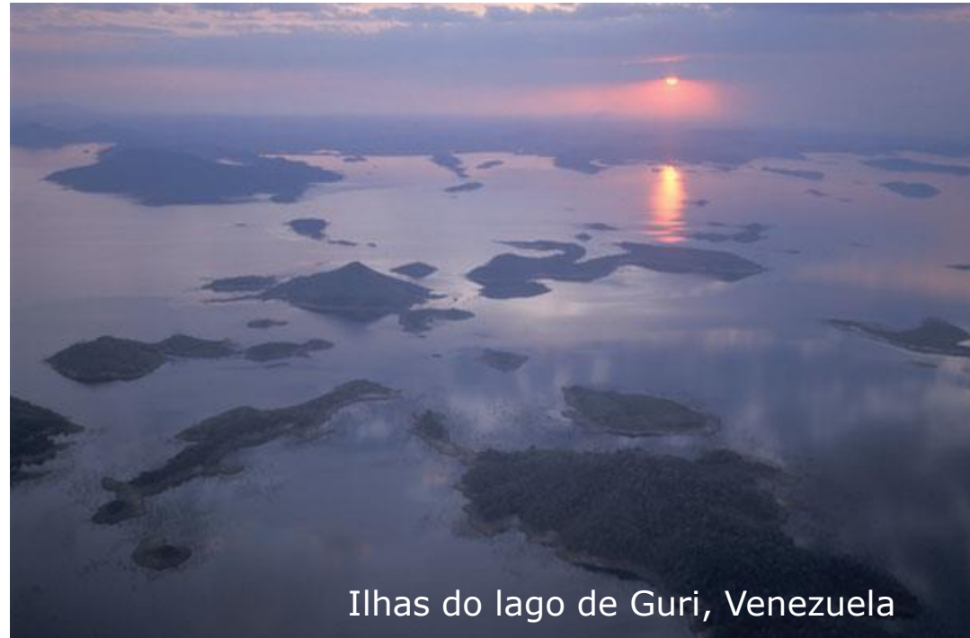
Ilhas do lago de Guri, Venezuela