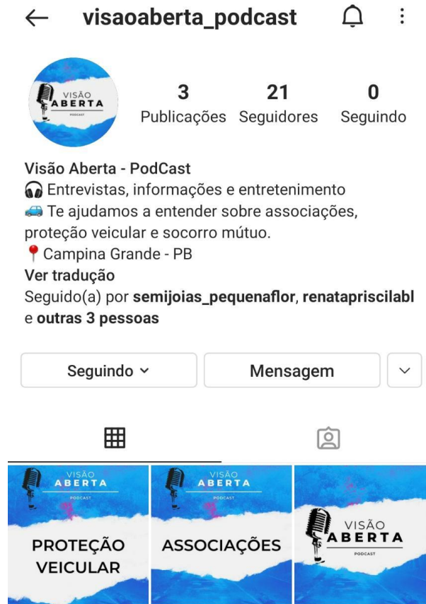
Figura 1: Instagram -Visão Aberta / Acesse: https://instagram.com/visaoaberta_podcast?utm_medium=copy_link

Para definição do nome do nosso Podcast escolhemos Visão Aberta. Que é um Podcast voltado para informações, depoimentos, esclarecimentos, sobre o mundo das associações de socorro mútuo.