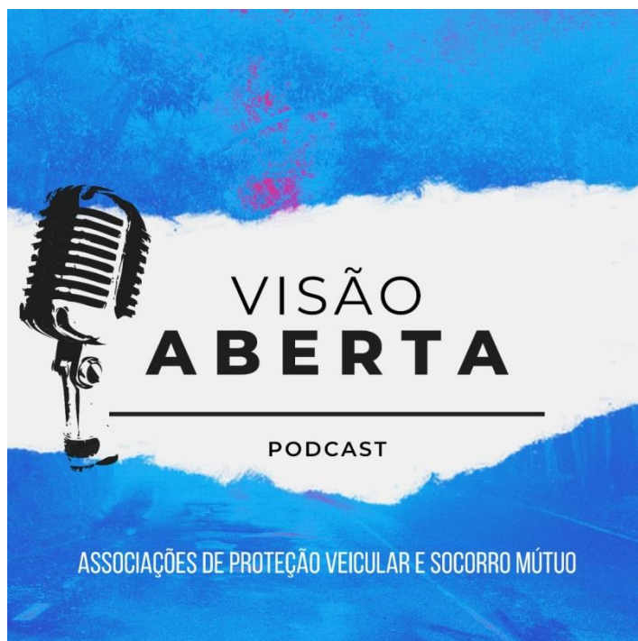
Figura 3: Episódio 2 no spotify