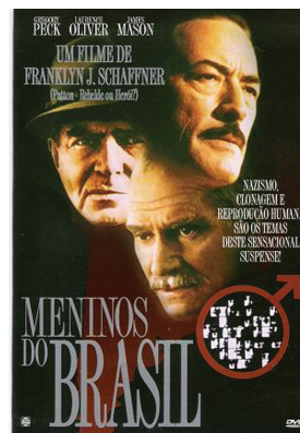
Figura 4: Capa do filme Meninos do Brasil (1978).

Hitler. Em 1978 (quando o filme foi lançado), a clonagem ainda não era realidade, mas nessa época havia as pesquisas sobre a combinação genética e a recombinação do DNA (iniciadas na década de 1970) que deram as bases para a engenharia genética, proporcionando um grande avanço da área nas décadas de 1980 e 1990. A possibilidade de a Ciência reproduzir a vida humana, por meio dos genes, faz surgir filmes desse gênero. Nessa época, entretanto, aparece também nos filmes outra temática que abordava as questões relativas ao meio ambiente.