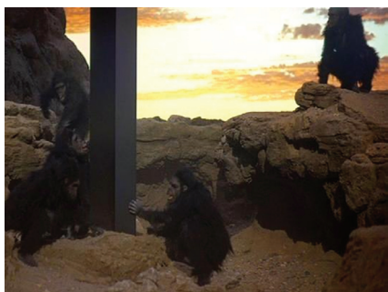
Figura 3: Cena do filme 2001: uma odisseia no espaço (1968): o portal da passagem do tempo.

Dessa época, também é importante destacar dois clássicos que atravessam gerações: A máquina do tempo (1960) e 2001: uma odisseia no espaço (1968). Nestes, o cinema tenta marcar fortemente a presença das máquinas na condução do destino dos homens. No primeiro filme, um aparato transporta Rod Taylor até uma civilização que perdeu totalmente suas características normais devido a séculos de guerra. A humanidade foi reduzida a duas classes sociais: os passivos Eloi e os repugnantes Morlocks. O segundo (Figura 3) é uma contagem regressiva para o futuro, o mapa para o destino da humanidade, uma indagação para o infinito. A viagem começa no nosso passado ancestral, então salta milênios para colônias espaciais, onde o astronauta Browman entra no espaço sideral, até a sua imortalidade. Neste, o cinema questiona as invenções da ciência (as máquinas criadas pelo homem) e a possível ameaça destas à própria vida do homem. Novamente, a ideia do filme Frankenstein – ‘a criação se volta contra o criador’ – aparece nesse filme com uma nova roupagem.