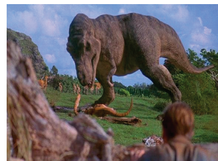
Figura 6: Cena do filme Parque dos dinossauros (1993).

Assim, a década de 1990 foi marcada por filmes nos quais o tema principal era a engenharia genética e, especialmente, o processo de clonagem. Na maioria dos filmes, a primeira parte explica as conquistas da Ciência e, na continuação, os cientistas tentam fugir das consequências de suas descobertas/criações. A genética era apresentada como tema de filmes sobre o futuro do planeta e da humanidade. Exemplos: Parque dos dinossauros (1993) (Figura 6), Gattaca (1998). Em filmes do gênero comédia, não se buscava imprimir realidade ao tema da clonagem. Exemplos: Eu, minha mulher e minhas cópias (1996), Uma aventura de Zico no Brasil (1998).