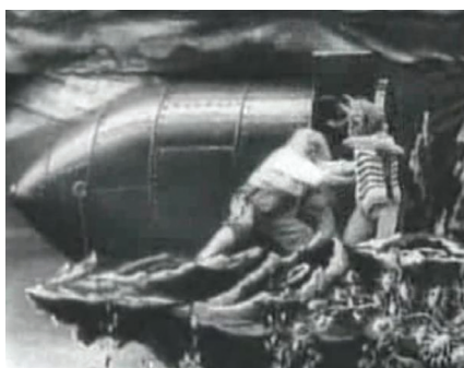
Figura 1: Cena do filme Viagem a Lua (1902): os astrônomos fugindo dos seres encontrados na Lua.

em 1902, com o filme Le voyage dans la lune (Viagem à Lua) de Georges Méliès (Figura 1), baseado no romance homônimo de Júlio Verne, tido como o primeiro filme de ficção científica produzido para o cinema. O filme se inicia com uma reunião na Academia de Astrônomos da França. Os cientistas discutem os planos para uma viagem à Lua, usando trajes de trabalho, muito semelhantes às vestes de feiticeiros. Antes de embarcar na cápsula, que será lançada por um canhão em direção à Lua, eles trocam as vestes por roupas de expedição. Viagem à Lua é considerado hoje um curta metragem, em que Méliès mostra uma das visões fantasiosas que os homens possuíam da Lua nos primeiros anos do século XX. Uma expedição formada por homens corajosos que vão à Lua, onde encontram seres nada amistosos. Lá, distantes de seus locais de trabalho, os “cientistas” são capturados, mas ao final, por meio de técnicas de trucagem cinematográfica, conseguem escapar e retornar ao nosso planeta.