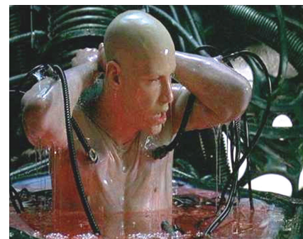
Figura 8: Cena do filme Matrix (1999): o personagem principal Neo conectado as máquinas.

o domínio das máquinas. A grande intenção dos produtores desse filme foi confrontar o virtual à ilusão do cotidiano e nos fazer questionar a respeito do que é o real num mundo virtual e o quanto a Ciência, por meio das máquinas, poderá formar um novo tipo de humanidade. Em X-Men , encontramos a presença dos seres mutantes que resultaram da evolução e alterações genéticas que detêm poderes de super-heróis. Os cientistas, no filme, veem esses seres como um novo degrau da evolução humana, mas os X-Men convivem com homens comuns e, muitas vezes, são considerados uma ameaça à sociedade humana. Como esse é um filme baseado em super-heróis, aparece a luta entre o bem e o mal. Alguns mutantes utilizam seus poderes para dominar o mundo, porém o filme traz a figura relevante do cientista-professor Xavier que percebe que os mutantes devem ser educados para controlar seus poderes e utilizá-los para o bem. Assim a educação aparece como forma de transformação e construção dos indivíduos.