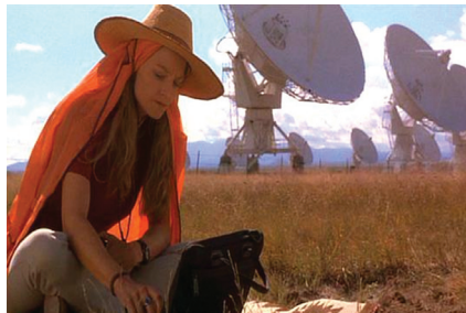
Figura 7: Cena do filme O contato (1997): a cientista coletando dados.

O século XX terminou com grandes conquistas para três áreas da Ciência: a Quântica, a Genética e a