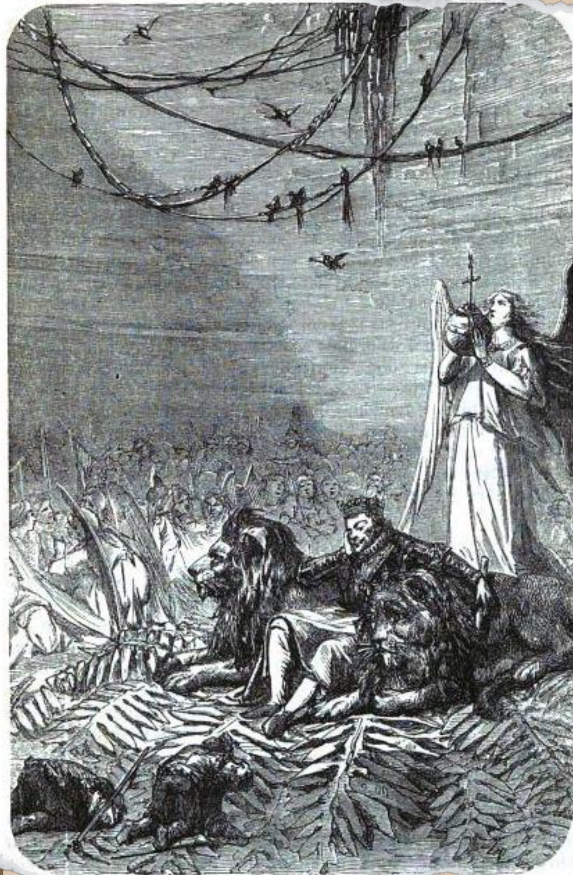
Dom Sebastian pã ōn "Inc