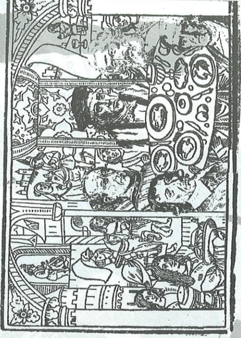
le chateau mystérieux

FERMÉ À DIX HEURES POUR UNE RÉUNION PRIVÉE