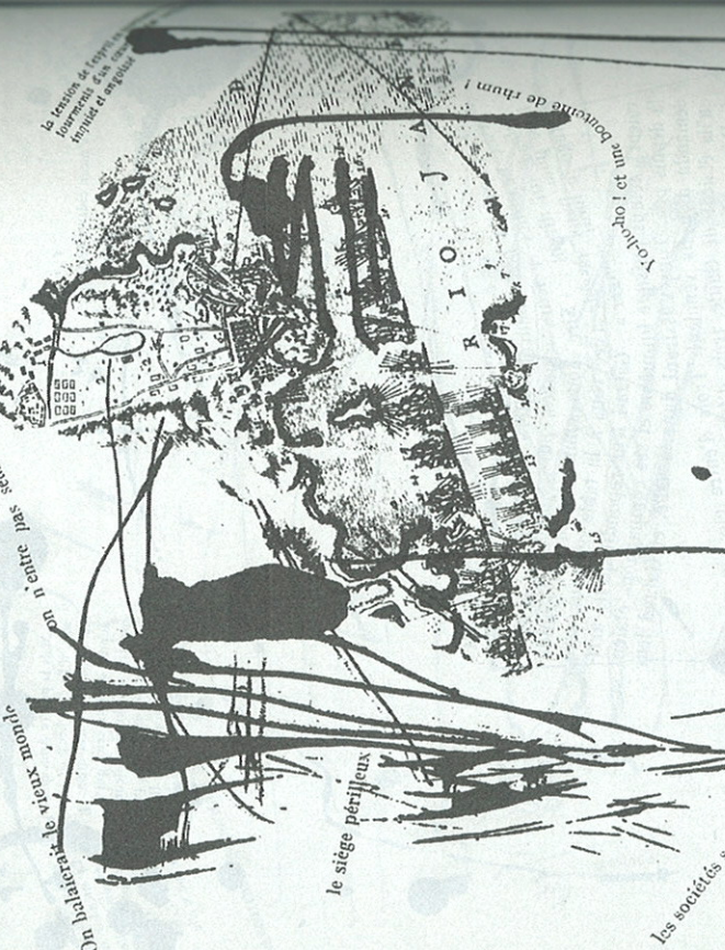
le siège périlleux

Le trépas de l'empereur d'occident, de son hospital et de son lit