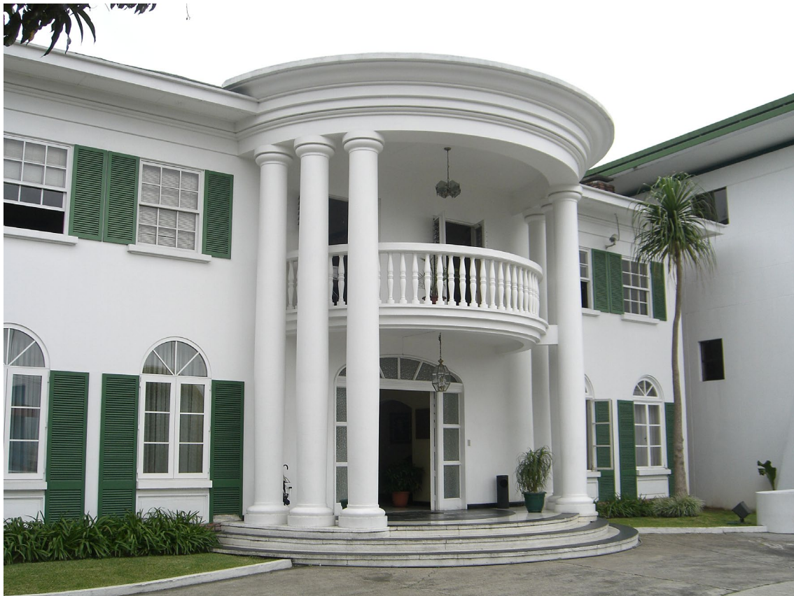
Corte Interamericana de Derechos Humanos