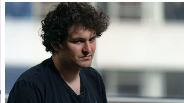
Sam Bankman-Fried, ex-CEO da FTX