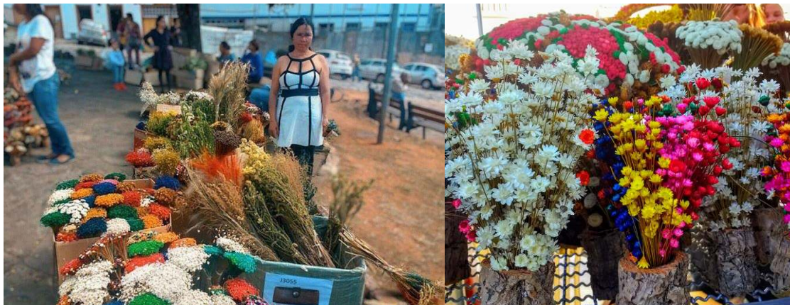
Imagem 2: Prancha fotográfica, comércio de flores sempre-vivas no Mercado Velho em Diamantina-MG. Apanhadora vendendo flores à esquerda e artesanato à direita.