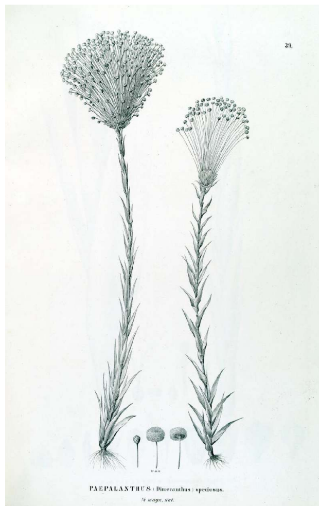
Figura 1: Ilustração de Paepalanthus (Dimeranthus) speciosus. Na atualidade Paepalanthus é o maior gênero de Eriocaulaceae, compreendendo cerca de 400 espécies distribuídas principalmente nos neotrópicos. Fonte: Martius; Eichler; Urban (Orgs.), 1906.

De certo modo, a vegetação do Distrito Diamantino é a mais peculiar e bem formada flora dos campos que se observa no planalto. As entroncadas Liliáceas arbóreas, Velózias e Barbacênias, são aqui mais abundantes do que nas outras partes de Minas, e são mesmo consideradas, pela gente do lugar, como indício da existência do diamante. Por entre as gramíneas peludas, verde-cinzentas, que, em grandes extensões, revestem as planícies deste Distrito, sobretudo são as Eriocauláceas que estão em grande número, com as suas umbelas de flores alvas pequeninas (Spix; Martius, [1824] 1981, p. 43, grifo nosso).