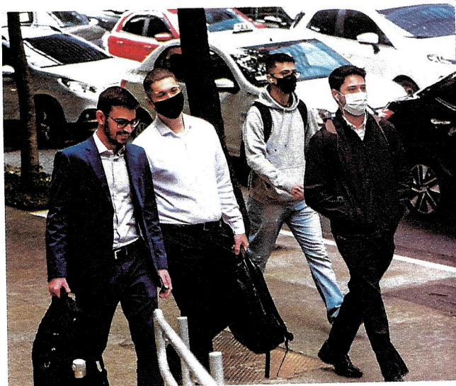
Jovens executivos em região de São Paulo que concentra grande número de empresas (1). Operador de telemarketing (2) e entregador de comida (3); primeiros empregos são marcantes no desenvolvimento da trajetória profissional