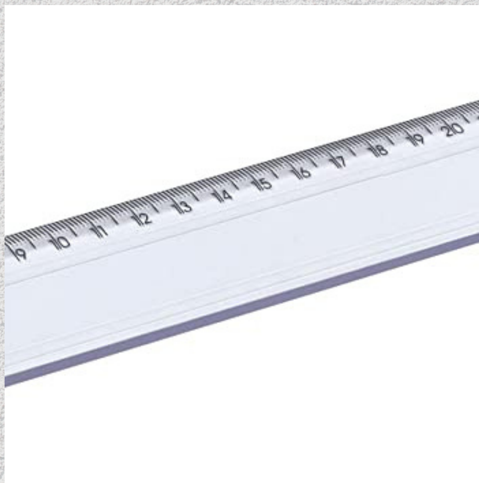
ESCALA PLANA 30 CM OU RÉGUA