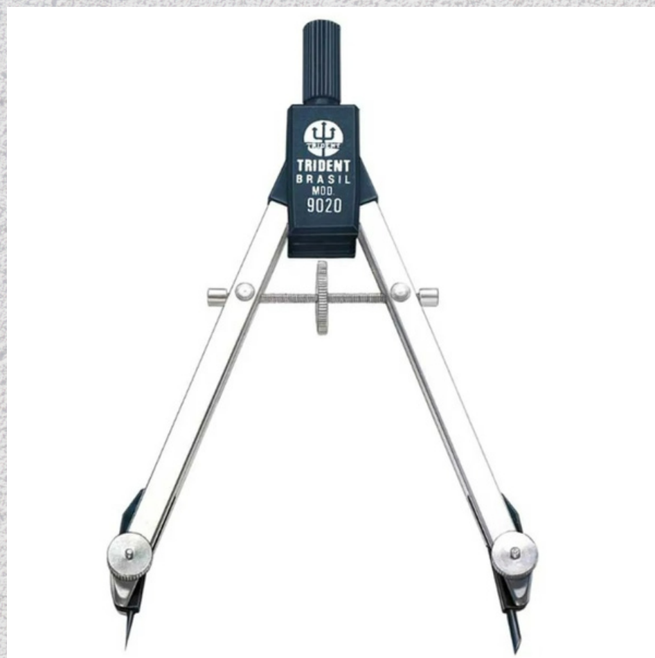
COMPASSO: SUGESTÃO: TRIDENT SÉRIE 9000