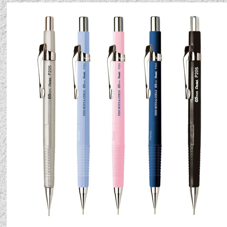
LAPISEIRAS 0.3, 0.5, 0.7 E 0.9 MM - PONTEIRA RETA PARA PERMITIR O USO NO ESQUADRO