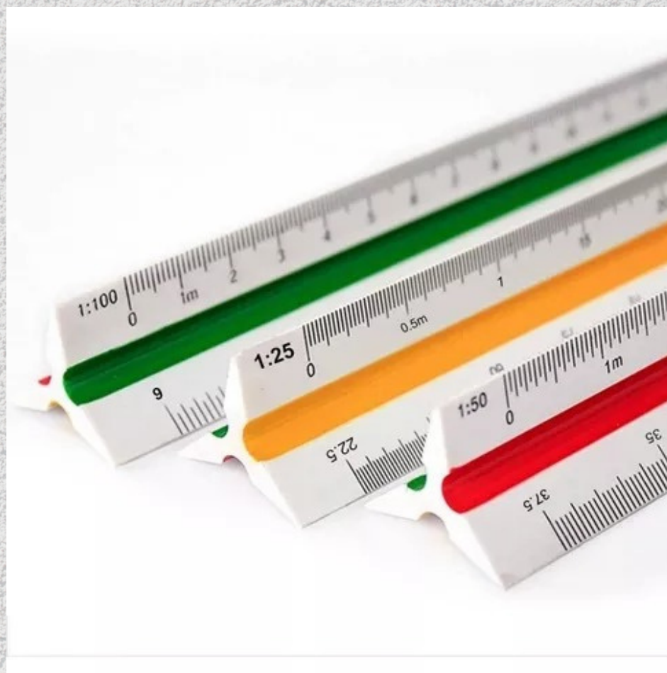
JESCALÍMETRO 1:100, 1:200, 1:250, 1:500 OU ESCALA TRIANGULAR DE 30 CM