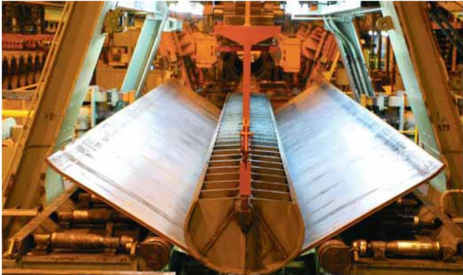
Figura 5 – Etapa de conformação do método SAW – Formação U-O-E (prensa U)