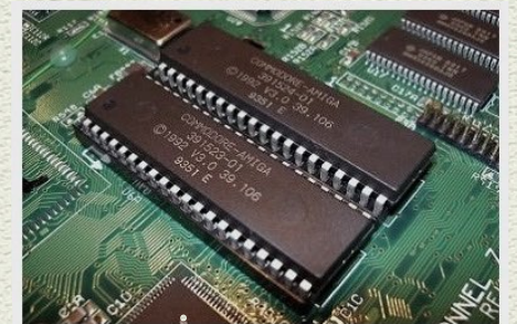
Read Only Memory