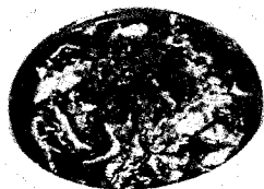
|| 水煮牛肉 16元 ||