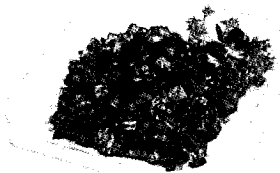
|| 老干妈炒三丁 16元 ||