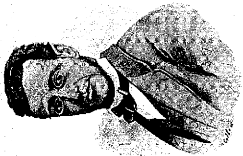
O chanceler argentino Rufino de Elizalde e o diplomata brasileiro Francisco Octaviano. Elizalde e Octaviano viam no Tratado da Tríplice Aliança o primeiro momento da construção de uma aliança estratégica entre a Argentina e o Império do Brasil.