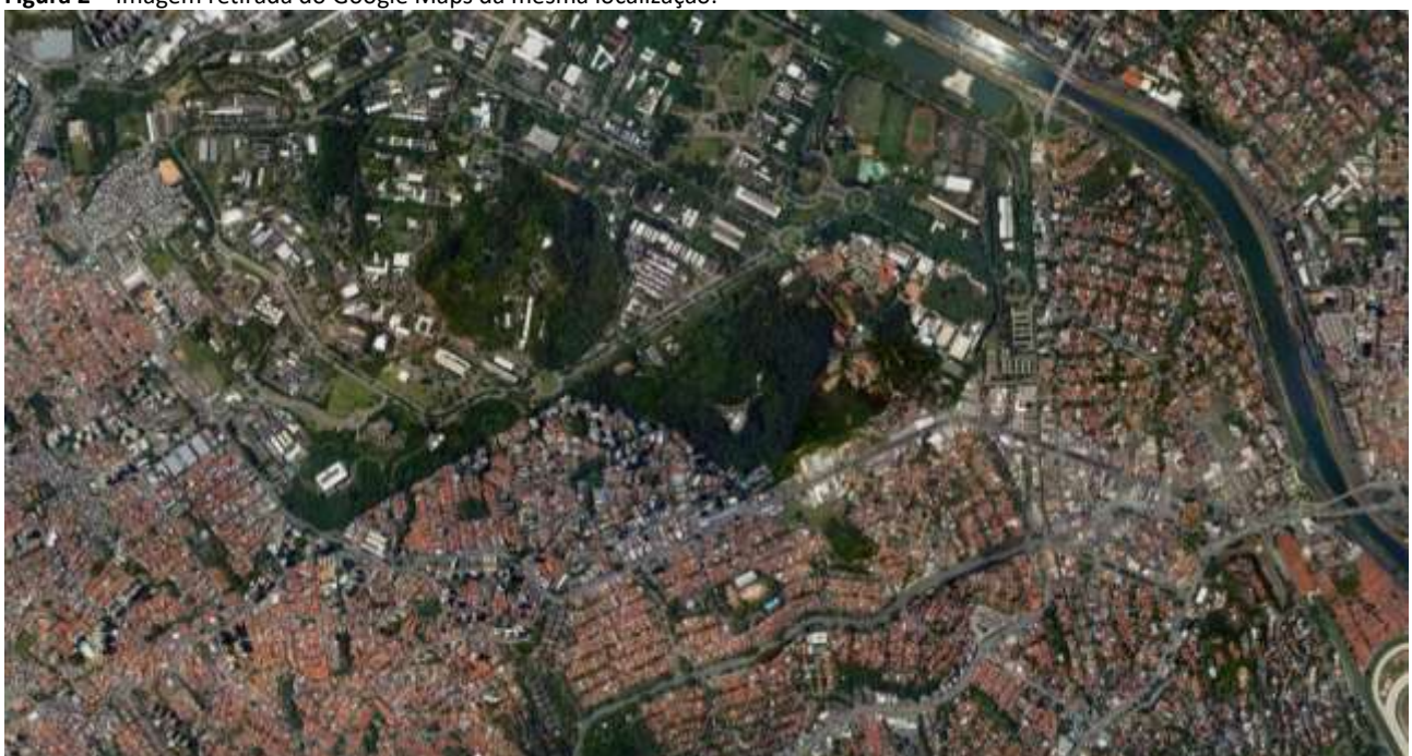
Figura 2 – Imagem retirada do Google Maps da mesma localização.