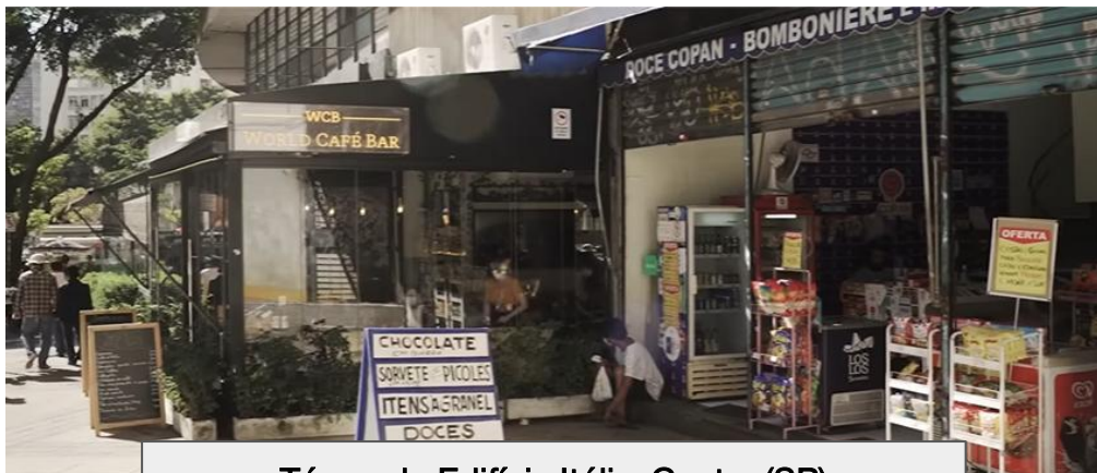
Térreo do Edifício Itália, Centro (SP)