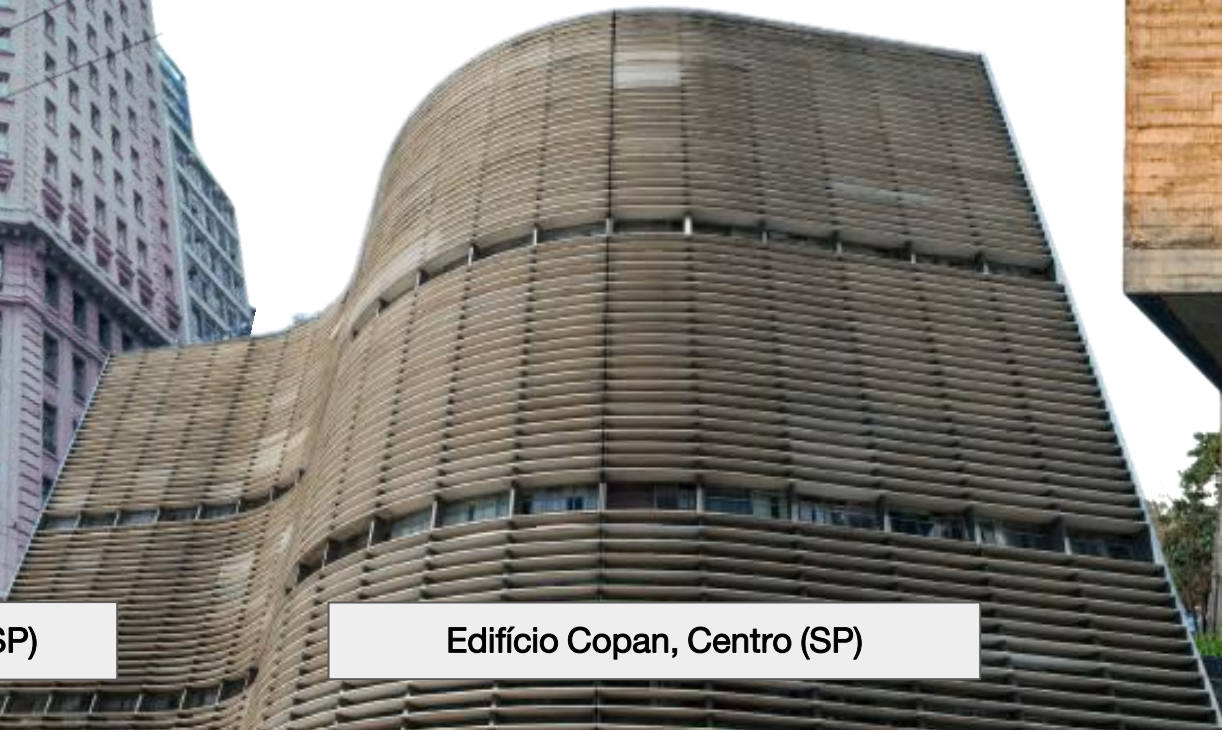
Edifício Copan, Centro (SP)