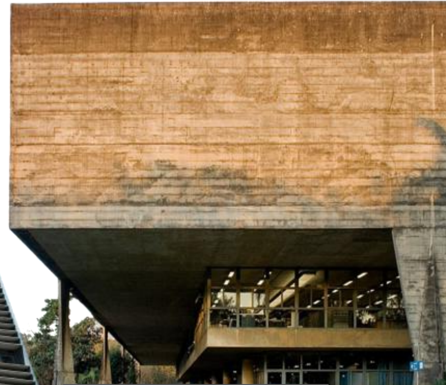
FAU USP, Butantã (SP)