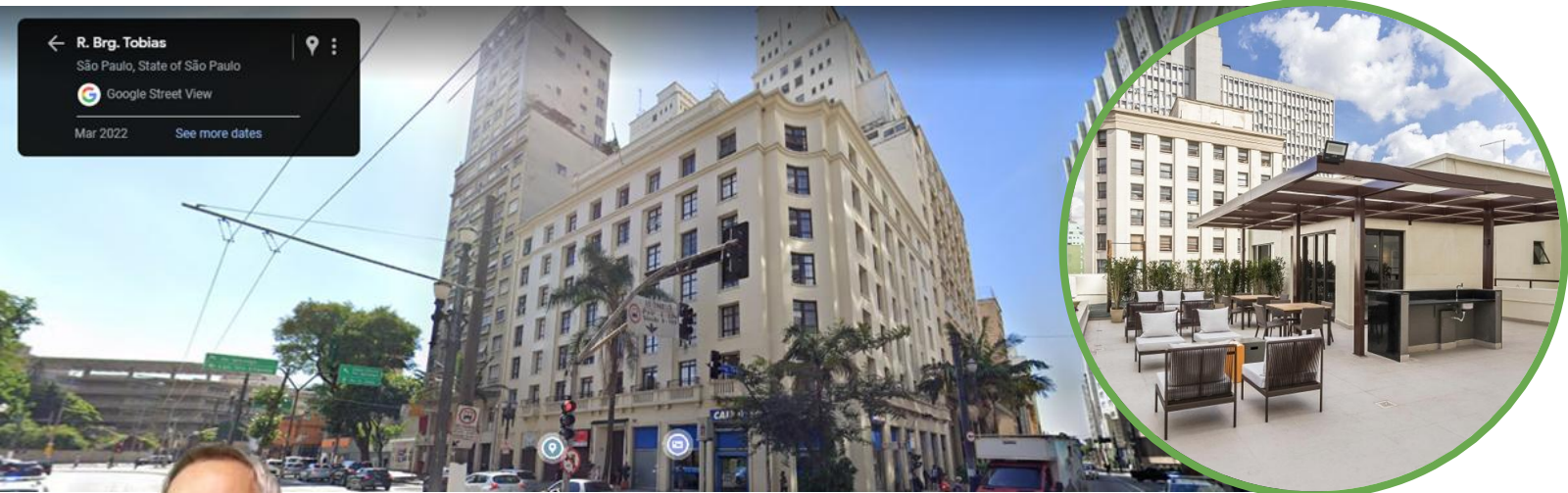
Edifício Wilton Paes de Almeida, Centro (SP)

Incentivar retrofits de prédios vazios e sem uso através de uma legislação efetiva e gestão competente