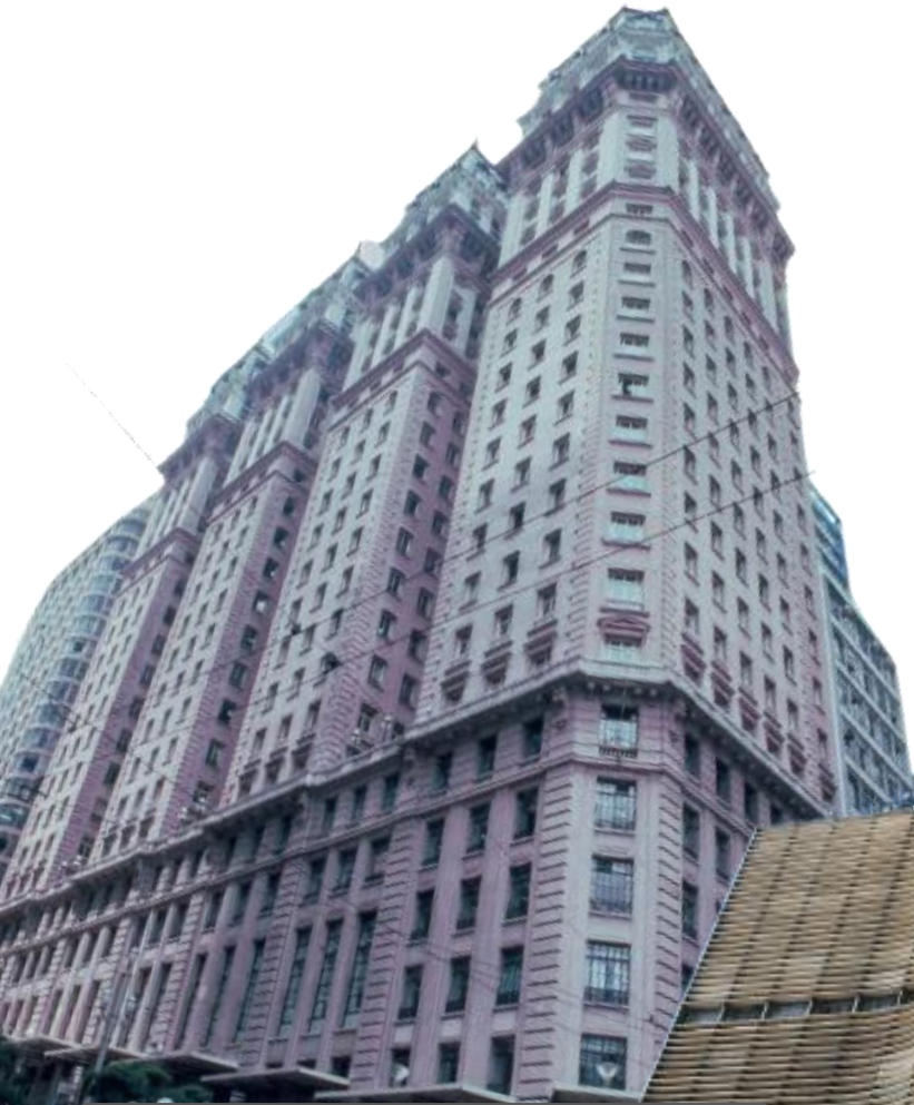
Edifício Martinelli, Centro (SP)

Algumas das mais icônicas edificações paulistanas não poderiam ser construídas mediante a legislação atual.