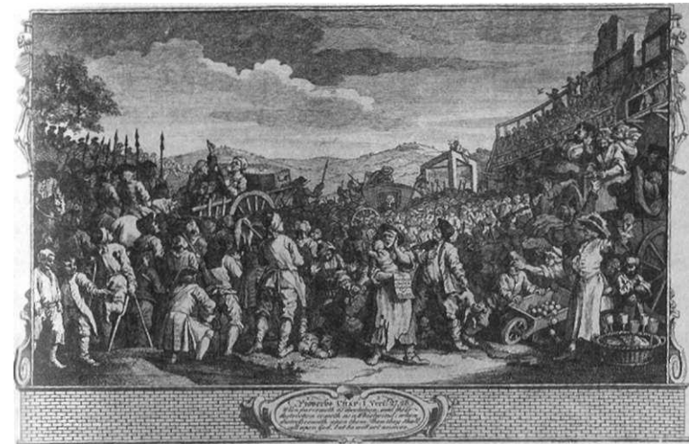
FIGURA 9. Procissão para Tyburn , por William Hogarth, 1747

Como a punição era um rito sacrificai, a festividade inevitavelmente acompanhava e às vezes eclipsava o medo. As execuções públicas reuniam milhares de pessoas para celebrar a recuperação