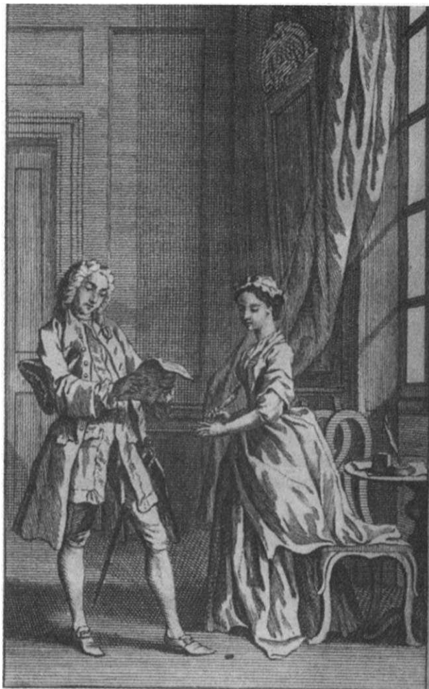
FIGURA 2. O sr. B. lê uma das cartas de Pamela a seus pais. Numa das cenas iniciais do romance, o sr. B. se aproxima impetuosamente de Pamela e pede para ver a carta que ela está escrevendo. Escrever é o meio de autonomia de Pamela. Os artistas e os editores não resistiram a acrescentar representações visuais das principais cenas. A gravura do artista holandês Jan Punt apareceu numa antiga tradução francesa publicada em Amsterdã.

manifestação de um eu interior, que no palco em geral tem de ser inferido a partir da ação ou da fala. Um romance de muitas centenas de páginas podia revelar um personagem ao longo do tempo e, ainda por cima, a partir da perspectiva do eu interior. O leitor não segue apenas as ações de Pamela: ele participa do florescimento de sua personalidade enquanto ela escreve. O leitor se torna simultaneamente Pamela, mesmo quando se imagina um(a) amigo(a) dela e um observador de fora.