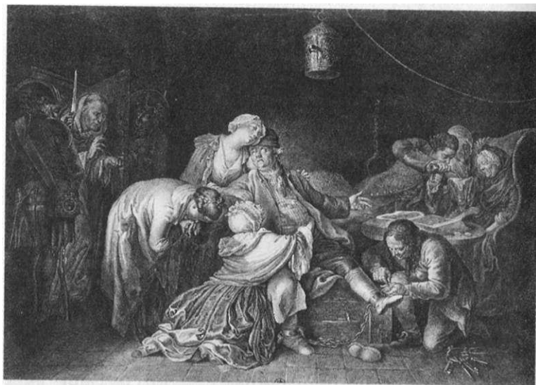
FIGURA IO. Sentimentalizando o caso Calas

A reprodução do caso Calas que teve circulação mais ampla foi esta, em tamanho grande (originalmente 34 x 45 cm), realizada pelo artista e gravurista alemão Daniel Chodowiecki, que fez a gravura a partir de sua própria pintura a óleo da cena. A água-forte estabeleceu a sua reputação e manteve viva a afronta sentida por toda parte devido ao castigo de Calas. Chodowiecki tinha se casado com uma mulher pertencente a uma família de refugiados protestantes franceses em Berlim apenas três anos antes de produzir esta gravura.