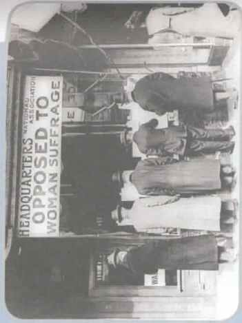
[Harris & Ewing, "Comité nacional contra o voto das mulheres", 1911. Biblioteca do Congresso EUA. cph-3a26270.]

Em alguns países, como nos Estados Unidos, houve no início do séc. 20 uma série de passeatas e manifestações pelo voto feminino. Como todo esforço de ampliação dos direitos das mulheres – e os de vários movimentos sociais de minorias –, este também gerou reações contrárias.