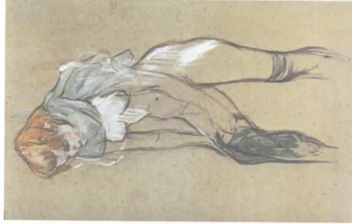
[Toulouse-Lautrec, Mulher se despindo , 1894, guache sb/ papel, 61,5 x 44,5 cm, Musée Toulouse-Lautrec, Albi, França.]

A discussão acerca desse trânsito e de como operam tais “arranjos” foi desenvolvida através da leitura crítica de diversos autores, particularmente das formulações do antropólogo francês Lévi-Strauss, que elaborou uma importante teoria do parentesco. Lévi-Strauss tinha proposto, em seu trabalho de 1949, 15 uma teoria sobre a passagem da natureza à cultura – ou seja, tentava entender o que diferia os homens dos animais. Ele notou que na natureza o comportamento dos animais é universal, ou seja, todos os animais de uma determinada espécie, por exemplo, um tipo de macaco, têm os mesmos comportamentos. Na humanidade, os comportamentos variam muito de um grupo para outro, há formas de organização social variadas, línguas diversas, regras específicas. Mas há uma regra universal, presente em todas as sociedades humanas: o chamado tabu do incesto , ou seja, a proibição de se manter relações sexuais com parentes muito próximos. O que cada sociedade classifica como parente próximo varia, mas há sempre um grupo de pessoas com quem não se deve manter relações. Essa proibição instaura a aliança – a associação e amizade entre diferentes famílias através do casamento da moça