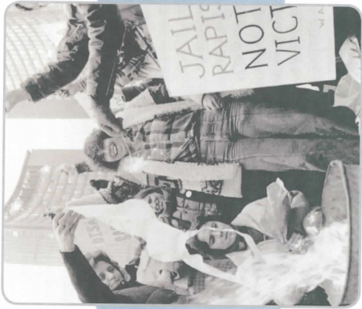
Manifestação feminista dos anos 1960 - a famosa imagem da queima de sutiãs, que simbolizam aqui a opressão ao corpo feminino.