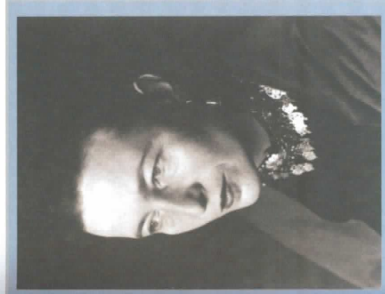
Simone de Beauvoir

Os argumentos formulados em O segundo sexo baseiam-se em uma leitura crítica da história, da psicanálise e da literatura. Paralelamente, a autora considera as experiências femininas da época analisando de maneira incisiva a maternidade e a conformação das identidades sexuais, dedicando capítulos à iniciação sexual feminina, ao drama da vida da mulher casada, à lésbica, à prostituta. Esses foram os aspectos que provocaram as reações contrárias mais fortes na época de publicação do livro, tanto por parte de setores católicos quanto por correntes de pensamento de esquerda.