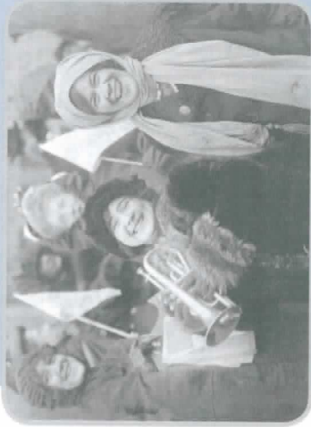
[Manifestação pelo direito ao voto feminino, fevereiro de 1913.]

Em alguns países, como nos Estados Unidos, houve no início do séc. 20 uma série de passeatas e manifestações pelo voto feminino. Como todo esforço de ampliação dos direitos das mulheres – e os de vários movimentos sociais de minorias –, este também gerou reações contrárias.