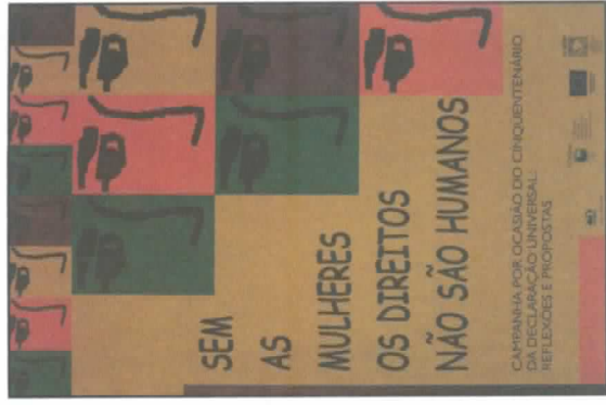
Cartaz de campanha pelos direitos das mulheres, em ocasião do cinquentenário da Declaração Universal dos Direitos Humanos.

O conceito de patriarcado foi estendendo-se no discurso político e na reflexão acadêmica, sem que fossem trabalhados aspectos centrais de seus componentes, sua dinâmica e seu desenvolvimento histórico. Com