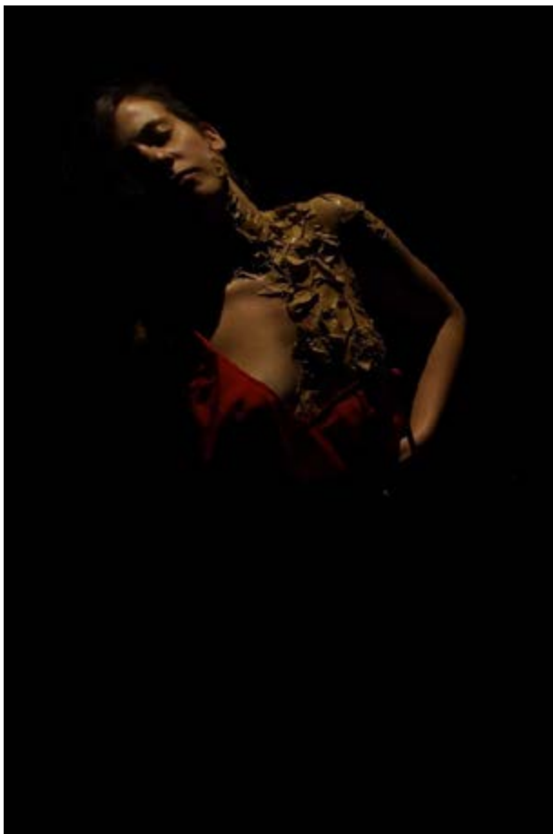
Judas: piedade para os Ratos.