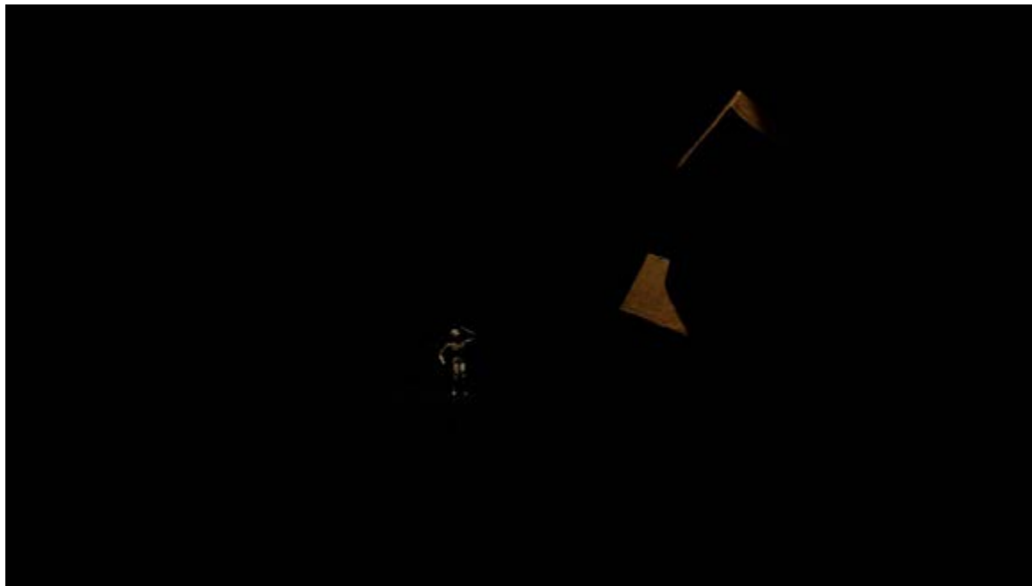
Paulicéia Desvairada - Foto: Wagner Cintra

e, por consequência, simbólico no entendimento do espectador, a sua aparência, por outro, amplia significativamente as possibilidades de significação, já que, mais do que geometria, esses cubos são objetos com texturas, as quais são espécies de leitmotivs visuais que nos permitem falar de certa Dramaturgia da Visualidade 14 , em que uma narrativa visual se constitui por meio de relações plásticas intrínsecas entre os objetos e as formas presentes no espaço.