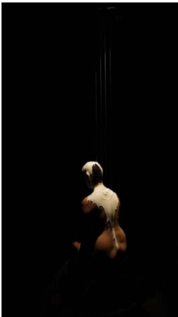
Paulicéia Desvairada

Por esse caminho, o corpo humano no Teatro Visual está livre da representação, já que é entendido somente como recurso material para a visualidade, seja como objeto visual, no caso de Leszek Madzik, seja como matéria bruta, no caso do Teatro Didático da Unesp. Ao humano não é atribuído nenhum valor além da condição de sua existência como elemento plástico. Nesse ínterim, o teatro visual se distancia da performance no sentido de que a experiência para o “performer visual”, talvez o termo mais adequado na ausência de outro, apesar de ser real, é uma realidade plástica: uma experiência plástica de contato do corpo humano com outras matérias expressivas promovendo uma experiência visual única. É exatamente essa inter-relação que liga o corpo do “performer visual” a objetos, máscaras e matérias diversas, que é fundamental para o Teatro Visual.