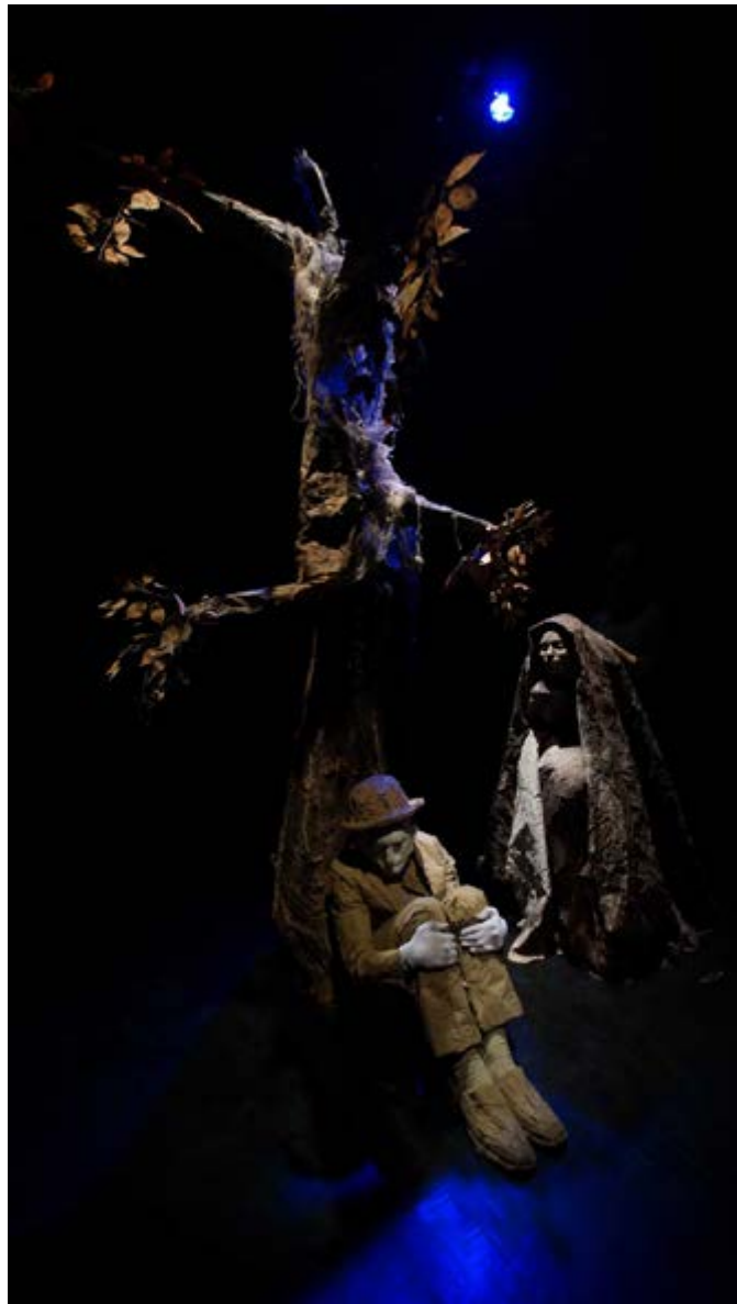
Judas: Piedade para os Ratos

Assim como em Pauliceia Desvairada , a encenação de Judas – Piedade para os Ratos não conta a história do discípulo de Jesus. Judas não está em cena. Ele é apenas intuído por meio das diversas situações que aludem a estados de comportamentos limite. Em cena, observa-se somente um insistente movimentar de seres incógnitos e inominados. As imagens intuídas do mito cristão converteram-se em alegorias da condição do homem ante uma realidade pautada pela decepção com as relações humanas. Entretanto, apesar de todo o pessimismo, sobremodo o de Augusto dos Anjos, que maravilhosamente contaminou todo o jogo cênico, evocado pelas imagens, ainda resta um fio de esperança, uma possível Piedade 9 como redentora de todas as mazelas deste mundo.