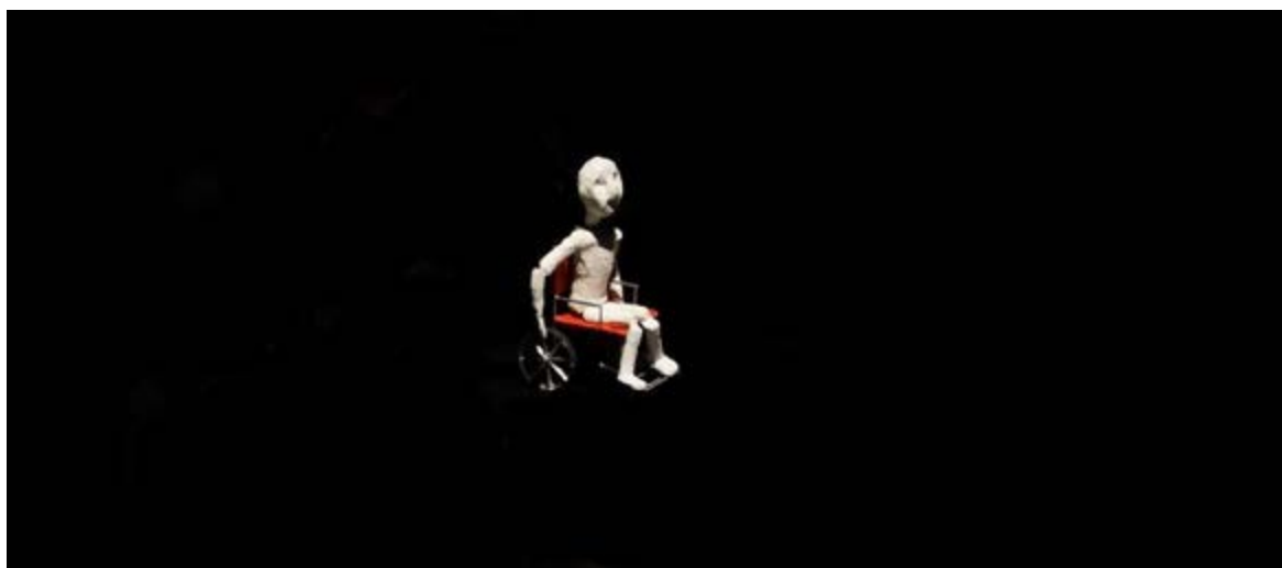
Judas: Piedade para os Ratos

A representação teatral é uma construção da consciência e a consciência é uma prerrogativa dos seres humanos. É exatamente por isso que não existe representação no universo do inanimado. Os objetos e marionetes desconhecem a consciência e, assim, não podem representar limitando-se à sua existência real. Em Judas: Piedade para os Ratos , o boneco na cadeira de rodas é um boneco na cadeira de rodas e sua existência se limita a essa condição visual que o determina como tal, ou melhor, como personagem real. Real porque ele existe, insisto, na sua condição de imagem e esta imagem só é possível por meio da matéria que o compõe. No caso, jornal velho e fita crepe.