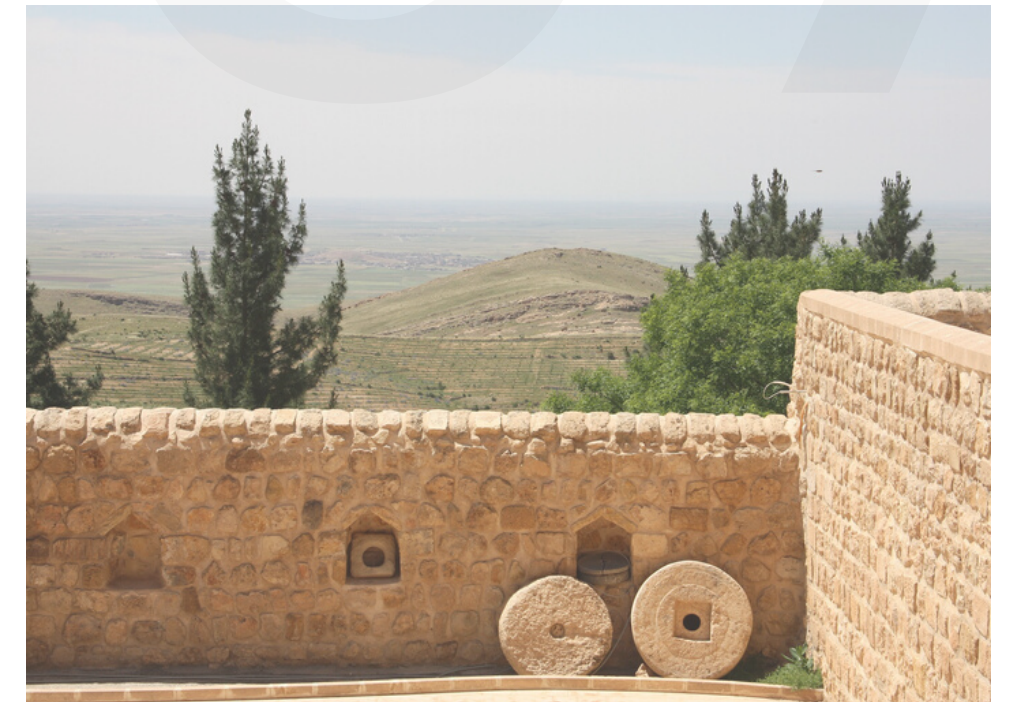
Características dos Impérios da Mesopotâmia