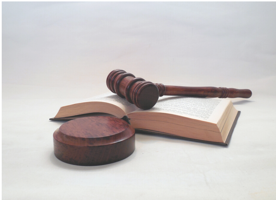
Influenciou a Legislação Social Moderna