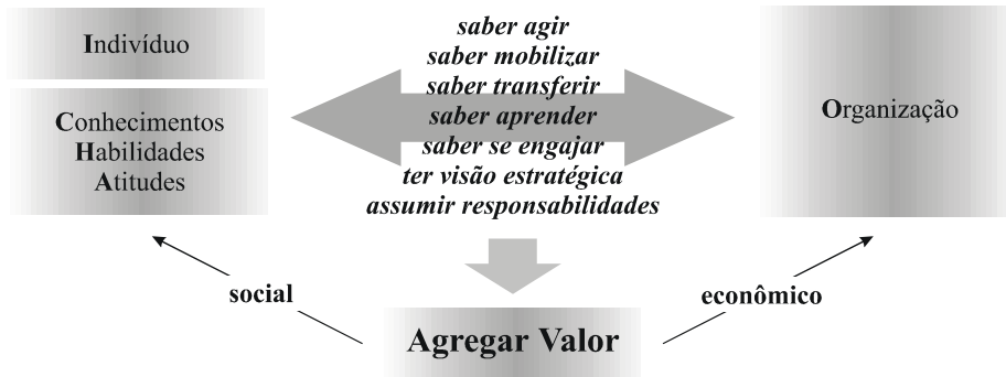
Figura 1: Competências como Fonte de Valor para o Indivíduo e para a Organização

Definimos assim competência : um saber agir responsável e reconhecido, que implica mobilizar, integrar, transferir conhecimentos, recursos e habilidades, que agreguem valor econômico à organização e valor social ao indivíduo.