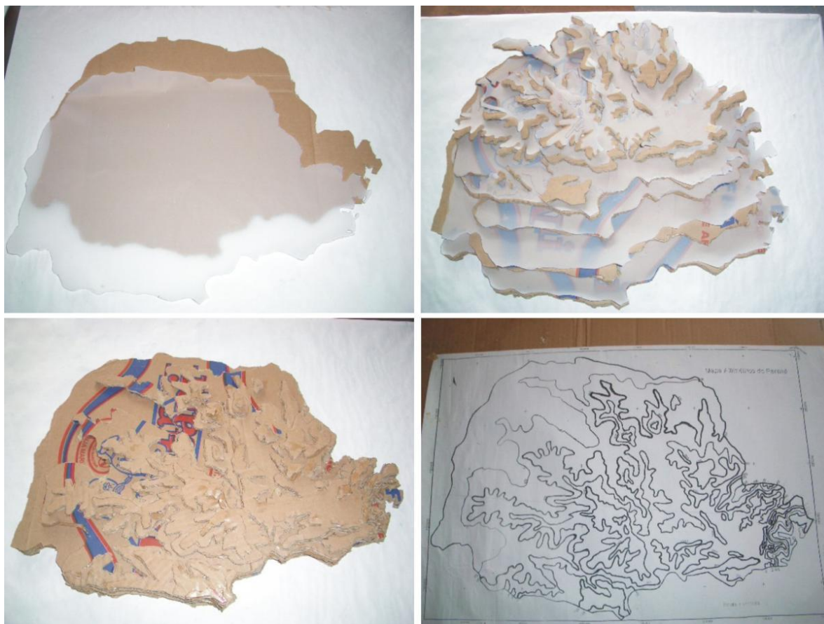
Figura 1 – Etapas da confecção da maquete base

Depois de definir o tamanho correto da maquete, e as escalas que serão utilizadas, fixar o papel vegetal com a fita crepe e contornar as curvas de nível, começando pelo mapa base, seguido pela curva de nível de 200 metros até 1200 metros com uma caneta, e recortando com uma tesoura. Transpassar os moldes de papel vegetal para a folha de papelão. Colar cada espaço definido por cada cota das curvas de nível recortada no papelão, iniciando a colagem com as cotas altimétricas mais baixas. Deixar secar bem (ver figura 1)