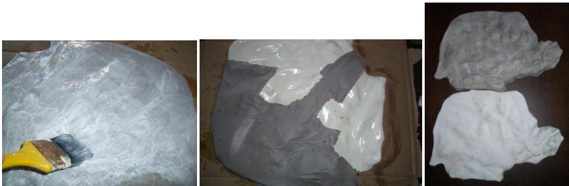
Figura 3 – Confeção das maquetes interativas.

e repetir a operação seis vezes. Fazer os acabamentos finais nas bordas da maquete, e para finalização passar massa corrida e água, com um pincel. Após a secagem, lixar. (ver figura 3).