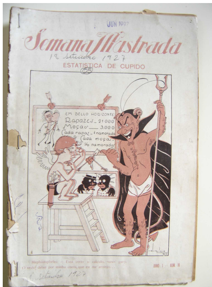
FIGURA 7: Estatística do culpido.

Tais estatísticas parecem ter incomodado os mineiros do período como pode ser observado na charge publicada na capa da revista Semana Ilustrada de setembro de 1927, onde as mulheres aparecem em “vantagem”.