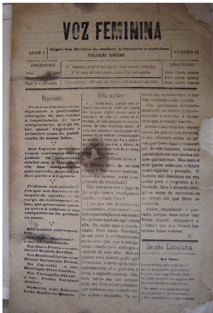
FIGURA 3: Jornal Voz Feminina