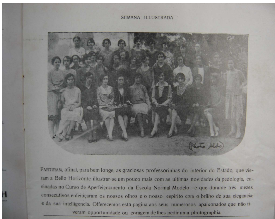
FIGURA 7: Alunas do curso de Aperfeiçoamento da Escola Normal Superior

Em 1928 a revista Semana Ilustrada publicou uma foto (abaixo) de uma turma de professoras que saiu do interior para se aperfeiçoar na capital mineira: