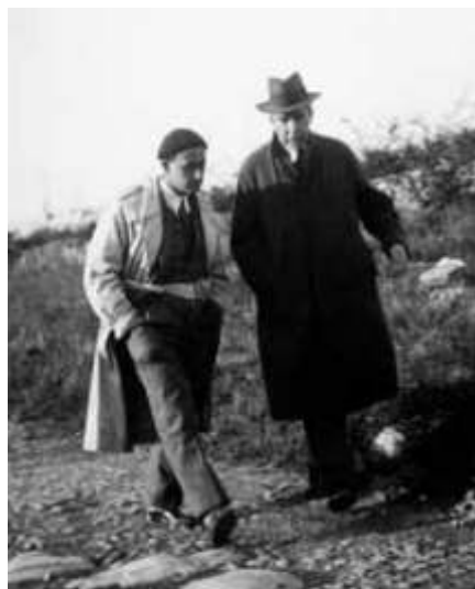
Enrico Fermi e Niels Bohr