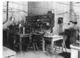
Laboratório de Rutherford

Resultados dos desvios das trajetórias, as partículas alfa permitiram o estabelecimento do seu modelo nuclear, que é análogo ao nosso sistema planetário. O núcleo central é positivo, e em torno dele gravitam partículas negativas: os elétrons.