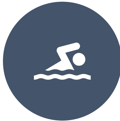
CASO 2 – NADAR