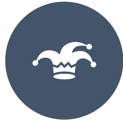
CASO 3 – CONTAR PIADAS / PENSAR