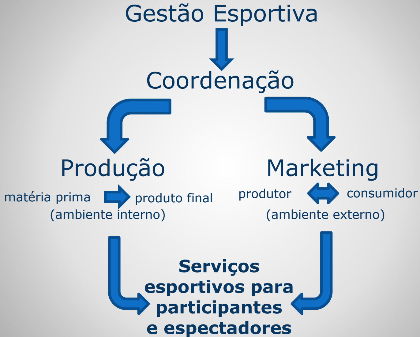
Figura 1 – Gestão do Esporte como coordenação das atividades de Produção e Marketing de serviços esportivos (adaptado de Chelladurai, 2009)