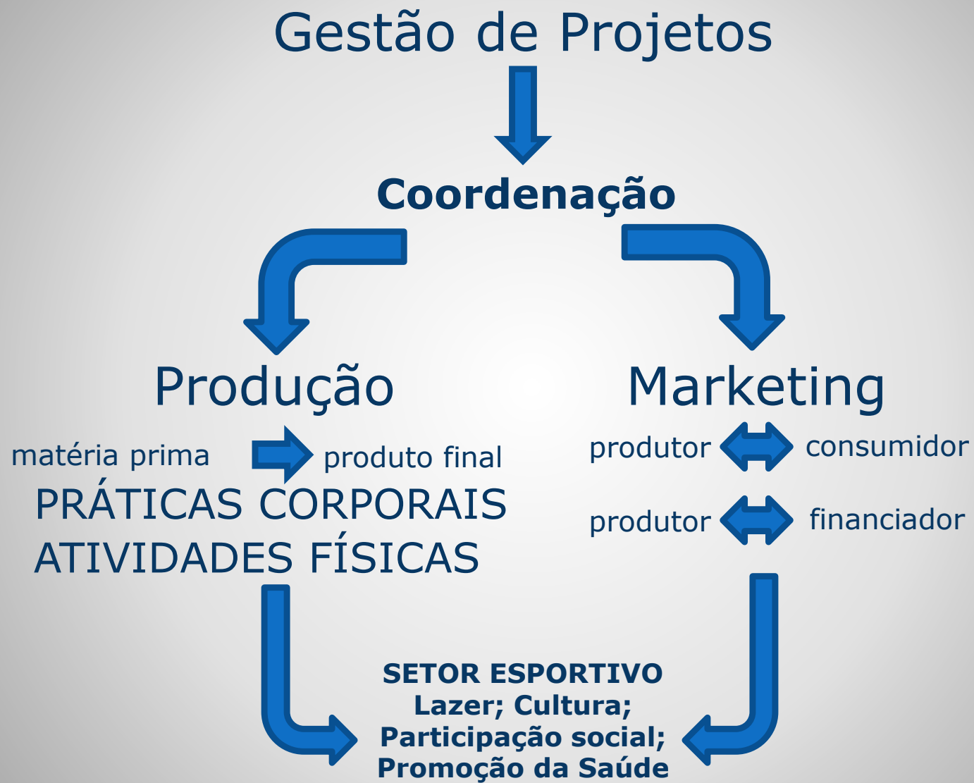
Figura 1 – Gestão de Projetos como coordenação das atividades de Produção e Marketing no setor esportivo (adaptado de Chelladurai, 2009)