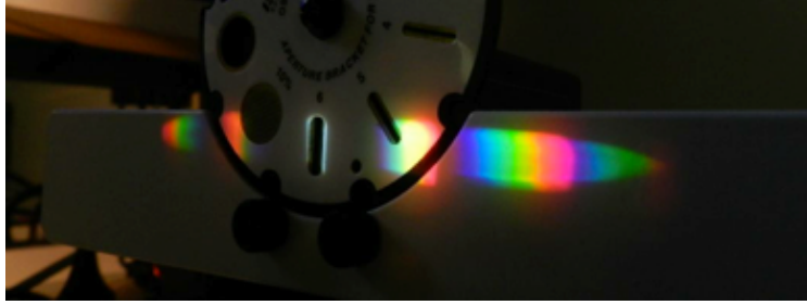
Figura 2: Espectro visível da lâmpada incandescente