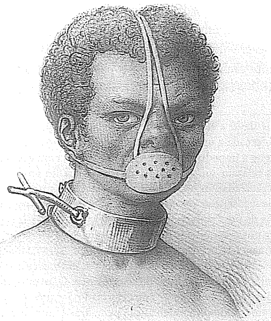
Retrato da “Escrava Anastácia” 4

No racismo, a negação é usada para manter e legitimar estruturas violentas de exclusão racial: “Elas/es querem tomar o que é Nosso, por isso Elas/es têm de ser controladas/os.” A informação original e elementar – “Estamos tomando o que é Delas/es” – é negada e projetada sobre a/o “ Outra/o ” – “elas/ eles estão tomando o que é Nosso” –, o sujeito negro torna-se então aquilo a que o sujeito branco não quer ser relacionado. Enquanto o sujeito negro se transforma em inimigo intrusivo, o branco torna-se a vítima compassiva, ou seja, o opressor torna-se oprimido e o oprimido, o tirano. Esse fato é baseado em processos nos quais partes cindidas da psique são projetadas