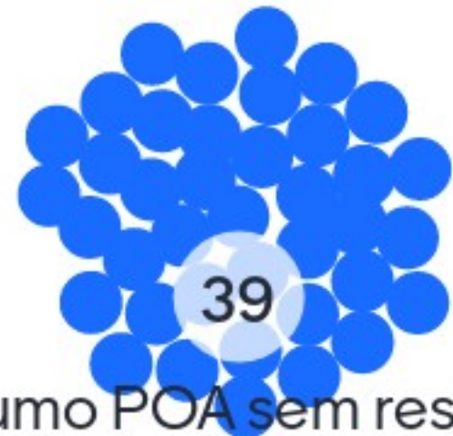
Consumo POA sem restrições