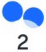
Não consumo POA, por restrições (ambiente, bem estar)