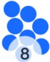
Consumo POA, mas tenho restrições (saúde)