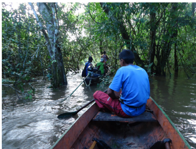
Figura 3 – O deslocamento pelo igarapé Piranhaquara

Considerando as condições de visibilidade e acessibilidade da área de pesquisa e que os Asurini não a percorriam há muitos anos, os procedimentos do survey foram adaptados para: