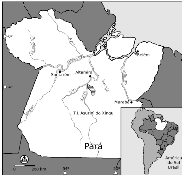
Figura 1 – Mapa de localização da terra indígena Asurini.

Em termos climáticos, a T.I. Kuatimenu compreende a zona climática A (tropical chuvoso), variação tropical de monção (Am). Este tipo climático tem como principal característica a ocorrência de chuvas do tipo monção, apresentando um regime de chuvas acentuado nos meses de dezembro a maio e uma estação seca nos meses de junho a novembro (Silva et al. 2011).