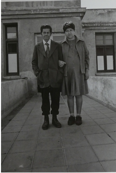
Imagen 7. Infarto del alma . 1994, p. 6.

ruinas, paredes sin pintura que se acentúan con el blanco y negro escogido por la fotógrafa para metaforizar el carácter de desecho con que se les ha tildado.