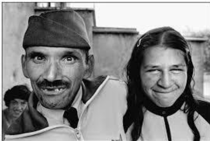
Imagen 4. Infarto del alma . 1994, p. 17.

este invento” (25). Todas estas configuraciones de la escritura hacen que el texto y el cuerpo de L. Iluminada estén en constante movimiento formando las poses en la plaza por medio de palabras que se exceden, proliferan y huyen de su significado instituido, al igual que L. Iluminada huye del luminoso, de la cámara y del lector que intenta posesionarla. Por lo tanto, cuerpo y texto se conjugan en una página, utilizando los elementos más materiales con lo que cuenta, a saber, escritura y piel, para transgredir el orden y la fijeza.