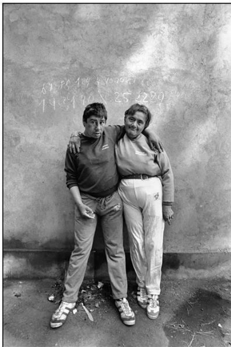
Imagen 6. Infarto del alma . 1994, p. 53.

de enfermedad o desarmonía, ya que atenta contra las reglas de la estética burguesa. La fotografía posee un papel familiar “por la función que le atribuye el grupo familiar, como pueda ser solemnizar y eternizar los grandes momentos de la vida de la familia, y reforzar, en suma, la integración del grupo reafirmando el sentimiento que tiene de sí mismo y de su unidad” (Bourdieu 2003, 57). Las bodas, los bautizos, las vacaciones son momentos que se desean sacralizar para un futuro, pero ¿qué sucede con las fotografías de estos marginados en el espacio del manicomio? Tenemos fotos de parejas que no son burguesas, sino de personas pobres, maltrechas, enfermas y, en algunos casos, deformes que parodian a esas familias burguesas.