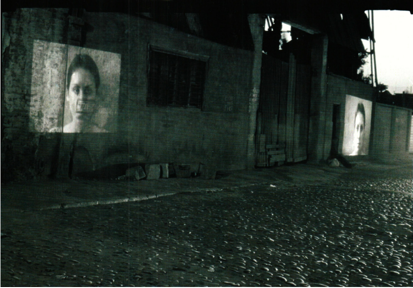
Imagen 1. Zonas de dolor . 1980.

luz y sombra pretende iluminar algo que no habíamos visto antes, mientras la fealdad de la periferia permanece en el fondo, no con la intención de ocultar la pobreza, sino de iluminar esa fealdad para transformarla en una belleza marginal. Lo oscuro es el fondo del escenario donde, como lectores/observadores, debemos distinguir que existe en ese fondo que se extiende hacia fuera. Es lo que Nancy llama “la resonancia de las formas” (2006a, 13) que emergen como una especie de vibración que resuena en el silencio de esa noche oscura y que la imagen reivindica. Lo que observamos no es la imagen como representación, es decir, la pobreza, la carencia, la prostitución, sino esa resonancia que se ha movido hacia fuera junto con la cámara y que me “con-mueve” como espectador. Esta conmoción, que me mueve, es el placer de gozar de ese movimiento que me produjo en el momento de la observación donde el fondo surge y se disemina en diferentes formas y zonas, provocando ese “ruido de fondo”. La cámara siempre está en movimiento, al igual que la cámara de Lumpérica , e inicia el recorrido con una vista panorámica del prostíbulo en la noche para hacer ingreso al interior del recinto.