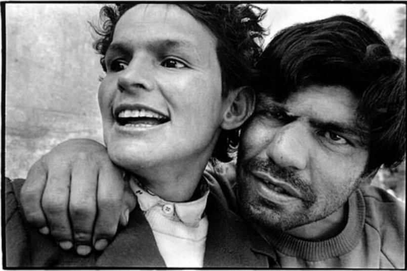
Imagen 5. Infarto del alma . 1994, p. 66.

que la política viene a fundar el arte. Dentro del área de la belleza fotografía, señala que el gesto facial es el último eslabón del carácter ritual, ya que el rostro humano constituye una belleza incomparable por su melancolía. Por ello que las treinta y ocho fotos en blanco y negro de Errázuriz se centran en estos rostros populares y marginados que estuvieron fuera de esa aura de autenticidad y nos muestran una nueva forma de ver el presente por el carácter único y singular de la fotografía que testimonia lo que ha estado o ha sido. Los rostros de los asilados muestran la enfermedad de la locura en primer plano con un orgullo que se condice con los parámetros de la fotografía clásica. Son el verdadero rostro de la marginalidad en todas sus posturas y poses.