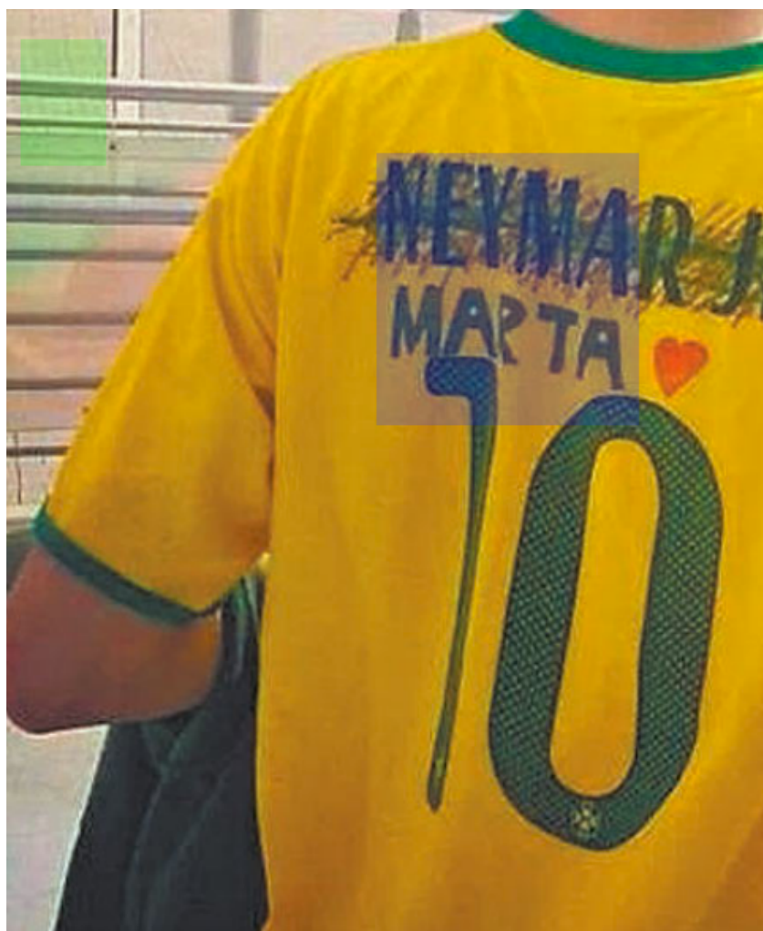
Figura 5 – Torcedor vestindo camiseta da seleção brasileira de futebol, extraído da reportagem B29.

A superação das mulheres em relação aos homens também pôde ser percebida no treinamento das atletas. Destacou-se de maneira positiva o preparo físico que lhes garantia aparência e desempenho equivalente ao masculino, conforme trecho a seguir: A nova fase a fez brotar mais forte, quase masculinizada, porém letal (B15).