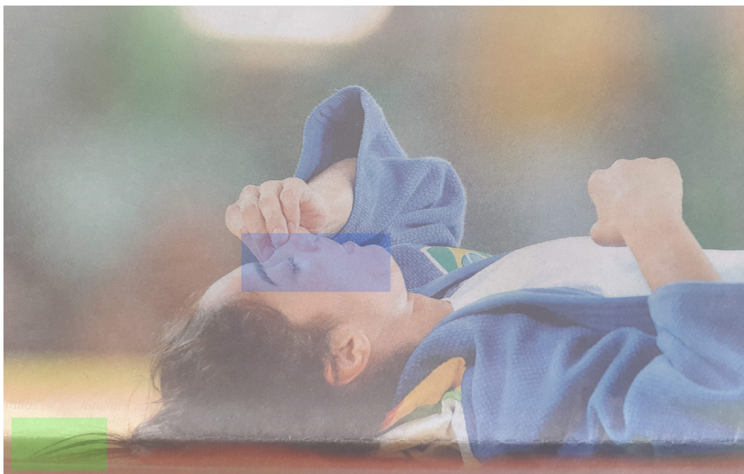
Figura 4 – Atleta chorando após derrota, extraído da reportagem A22.

Além de o choro ser ressaltado nos textos e nas imagens, constatou-se que a redação das reportagens tendia a destacar os estereótipos de feminilidade que estão relacionados à fragilidade da mulher, conforme apresentado nos trechos a seguir: [...] Ela tem um jeito delicado, quase angelical e parece mais jovem do que seus 31 anos (A17). No alto do pódio, ouvindo o hino da Hungria, ela parecia inofensiva, vulnerável (B23).