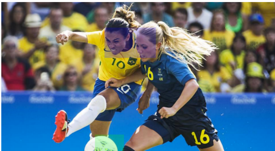
Figura 2 – Atletas disputando a posse da bola, extraído da reportagem B46.

No momento após as competições, as fotografias revelaram sinais de alegria associados à vitória. Nessas imagens, as atletas foram fotografadas sorridentes (Figura 3). No Jornal A foram selecionadas 14 referências, e no Jornal B foram 20 referências.