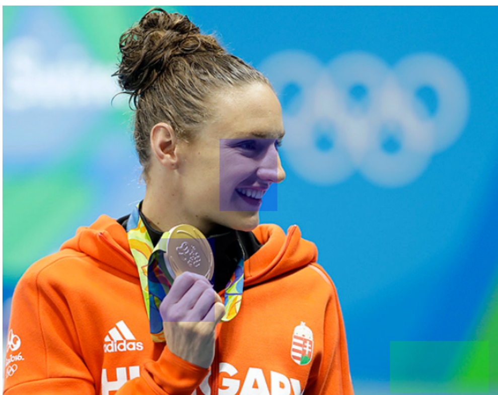
Figura 1 – Atleta segurando medalha, extraído da reportagem B2.

Nas imagens selecionadas foi possível observar ênfase na conquista de medalhas, na medida em que 11 fotografias foram registradas no pódio. Observou-se que as próprias atletas ressaltaram suas vitórias ao mostrar as medalhas no momento do registro fotográfico, geralmente apoiadas em uma das mãos e afastadas do corpo (Figura 1).