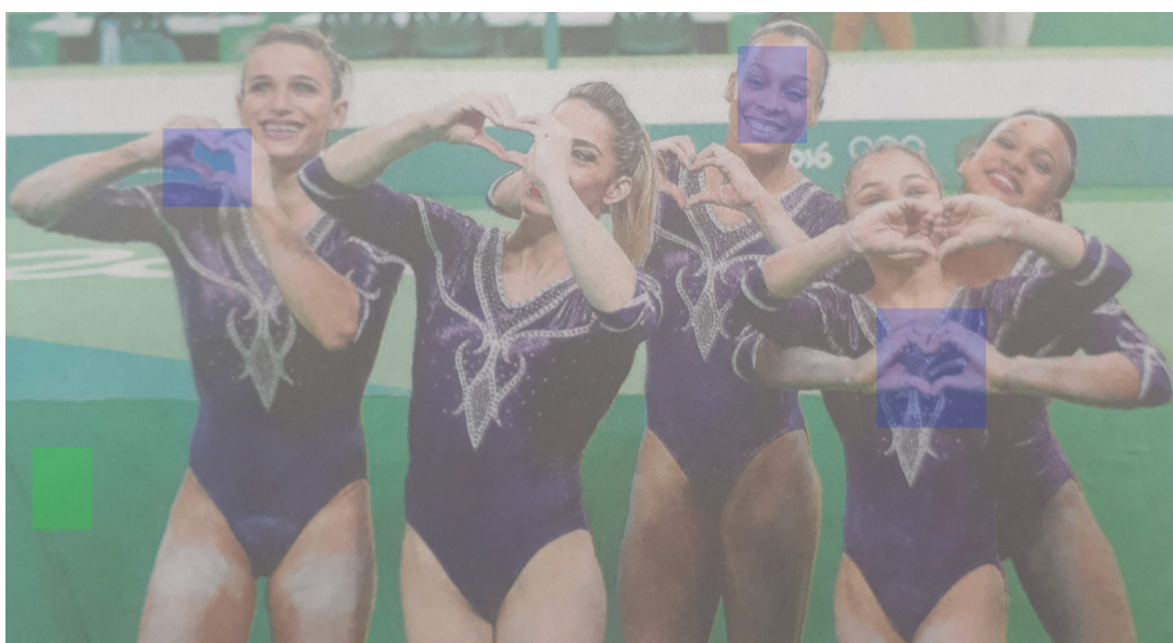
Figura 3 – Atletas comemorando a vitória, extraído da reportagem A8.

No momento após as competições, as fotografias revelaram sinais de alegria associados à vitória. Nessas imagens, as atletas foram fotografadas sorridentes (Figura 3). No Jornal A foram selecionadas 14 referências, e no Jornal B foram 20 referências.