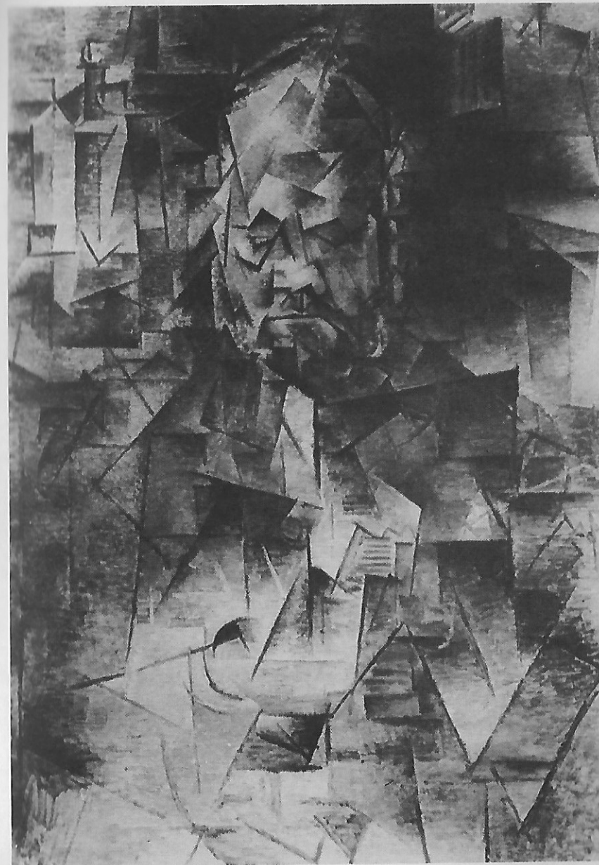
Pablo Picasso, Retrato de Ambroise Vollard (óleo sobre tela, 92x65 cm, Museu Pushkin, Moscou), 1910.

Ao contemplar o Retrato de Ambroise Vollard , do Ermitage, o espectador sente uma estranha sensação. Não só se encontra diante de uma figura desconjuntada, com as formas forçadas de um rosto distorcido, mas os elementos formais que operam essa violência — a disposição rítmica de linhas e ângulos — são experimentados como algo incongruente com a realidade “concreta” daquela figura, para não falar da realidade “anímica” ou “espiritual” do retrato. Mais ainda, a existência sensível da individualidade concreta, à que serve o gênero retrato, parece retroceder detrás da estrutura abstrata e geométrica das suas linhas e planos. É como se a imagem de Ambroise Vollard fosse contemplada através de um cristal translúcido que tivesse sido habilmente estilhaçado. É surpreendente o efeito artístico de semelhante composição, porque priva o espectador do gozo ou do consolo artístico que o título “retrato” parecia garantir-lhe. A forma pictórica não se submete à realidade da figura individual ou aos aspectos da sua expressão psíquica. Ao contrário, sobrepõe-se a ela, como se se tratasse de ocultá-la, senão de subjugá-la. Adivinha-se, inclusive, nesse tipo de composições um momento irônico, talvez a intenção artística de ironizar a pretensão de uma individualidade totaliza-