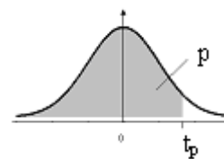
Tabela II: Distribuição t de Student

Fornece o quantil t_p em função do n° de g.l. v (linha) e de p = P(T \leq t_p) (coluna) T tem distribuição t de Student com v g.l.