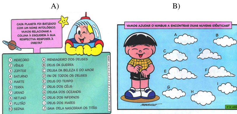
Figura 4 – Exemplos dos passatempos