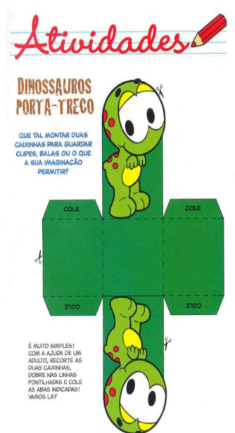
Figura 5 – Exemplo de atividade central