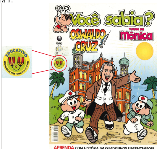
Figura 1 – Capa da edição sobre Oswaldo Cruz, com recomendação para trabalhos escolares sob o selo dos Estúdios Maurício de Sousa

Trata-se de material com indiscutível potencial para uso paradidático, uma vez que aborda os temas em uma linguagem de fácil compreensão para o público de Nível Fundamental, com personagens bem conhecidos e identificados pelas crianças. A Editora Globo revelou suas pretensões educativas ao colocar na capa, sob a logomarca dos Estúdios Maurício de Sousa, um pequeno aviso no qual se pode ler “Educativo – Recomendado para trabalhos escolares”, como pode ser observado na Figura 1.