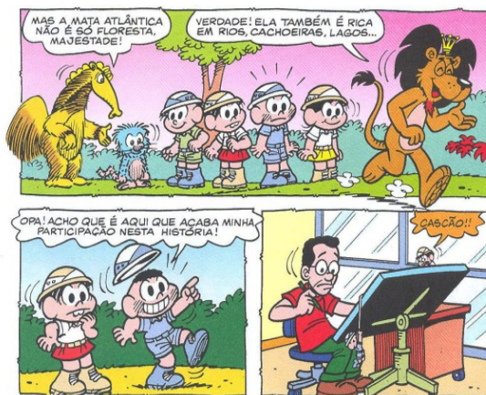
Figura 3 – Exemplo de metalinguagem com participação especial do desenhista