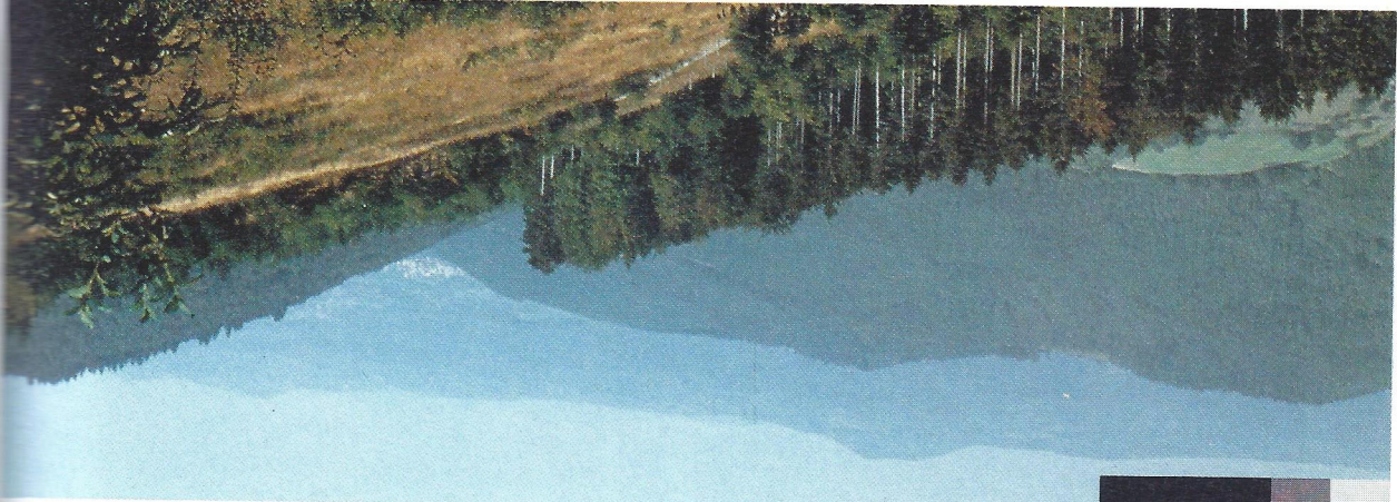
La « ligne bleue des Vosges »