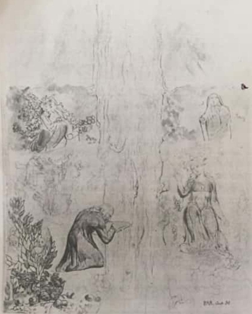
Dante bebe en el río de luz del Empíreo. Ilustración por William Blake. The Tate Gallery, Londres