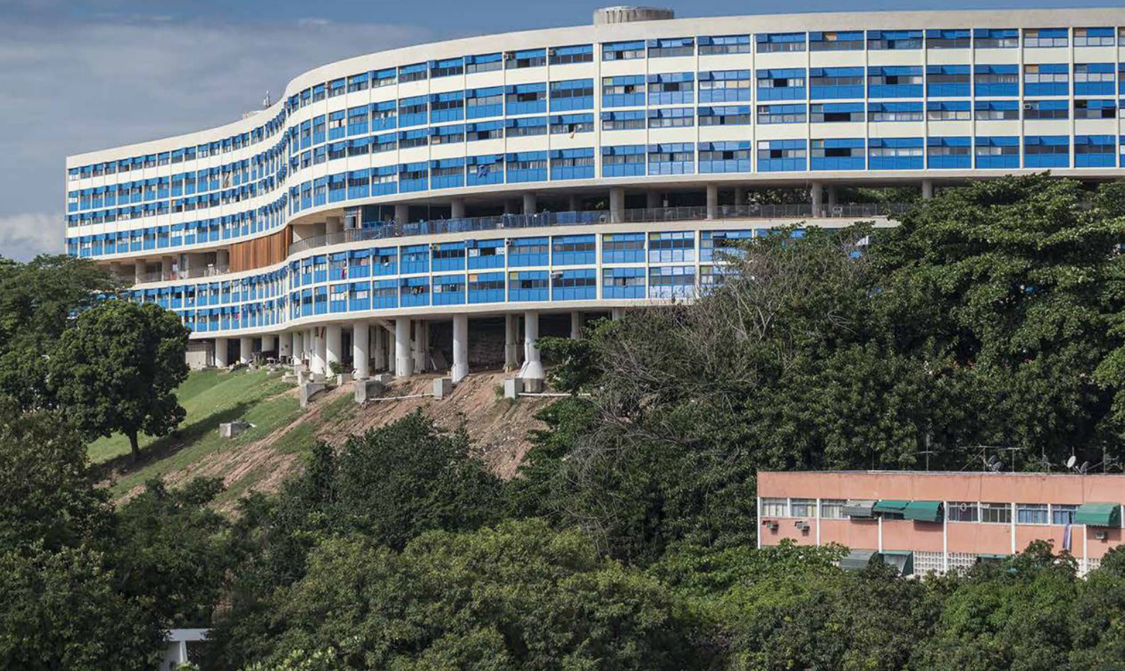
FIGURA 10 Vista geral do Bloco A após restauração.

verão carioca seria mesmo impossível, optou-se por disciplinar a sua instalação, com local adequado. Um detalhe que pode ser pequeno, mas que mostra como as apropriações e usos dos moradores ao longo do tempo nos edifícios residenciais dão significado novo aos paradigmas de projeto do moderno (como a do conforto térmico na arquitetura da chamada Escola Carioca) e se legitimam para ficar (BRITTO, 2015, p.107).