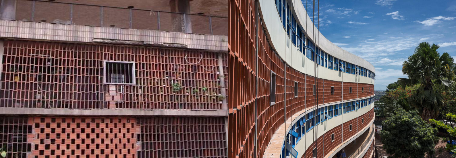
FIGURAS 12 e 13

Painel de cobogós antes e depois da restauração.