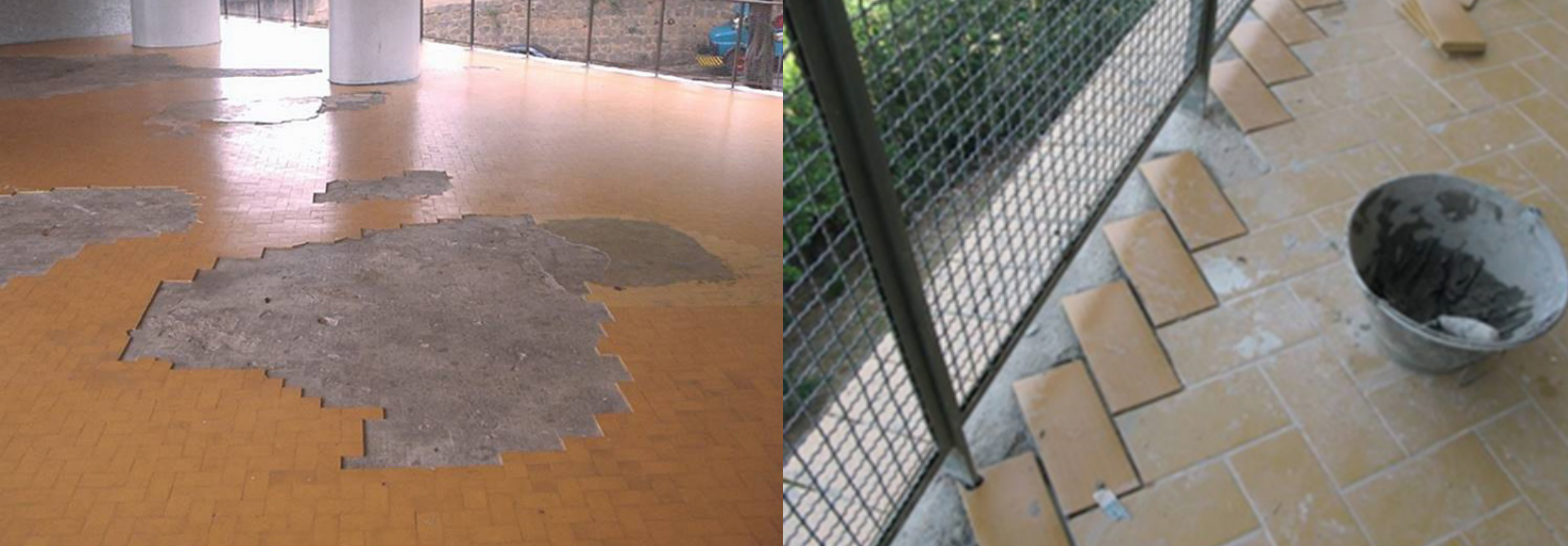
FIGURAS 14 e 15

Piso dos corredores antes da restauração e durante a fase de obras, vendo-se os detalhes do assentamento em espinha de peixe.