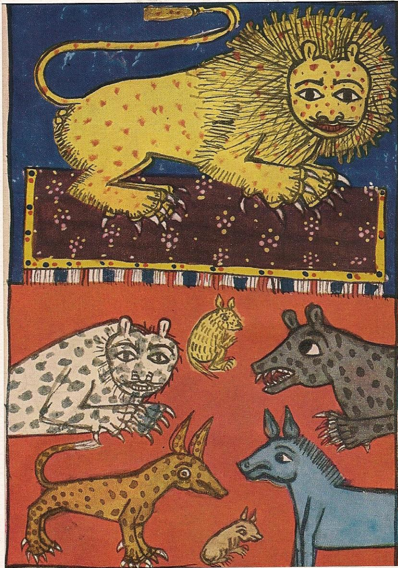
Les animaux malades de la peste, Abyssinie, 1934.