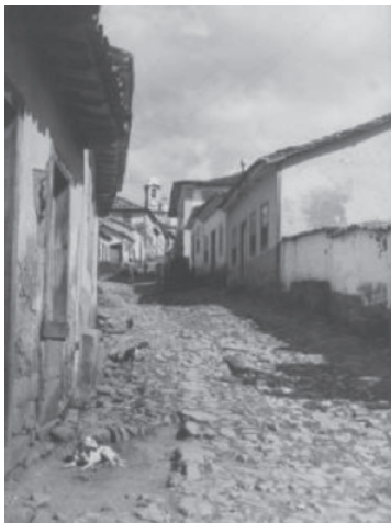
Tiradentes/MG. Foto Artur Arcuri, 1945

Eficazmente construída ao longo de 30 anos, a imagem da nação foi apropriada como ideia de patrimônio lato sensu , ficando esquecidos os motivos da origem e da escolha dos imóveis e sítios coloniais e/ou excepcionais como patrimônio. Não houve consciência de que esse patrimônio era um recorte feito sobre a produção brasileira em consonância com um projeto e um momento histórico específico, o que levou ao uso de critérios semelhantes de seleção do patrimônio cultural — observando-se aspectos estilísticos e a excepcionalidade — em contextos históricos diferentes e diante de novos projetos de identidade cultural.