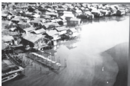
Vista das palafitas da Maré.

Hoje são mais de três gerações que ocuparam e transformaram a localidade. Gerações constituídas por pessoas que foram deslocadas das favelas da Zona Sul e Norte do Rio de Janeiro, que se deslocaram da zona rural, por migrantes de diversas partes do Brasil, principalmente de Minas Gerais e do Nordeste e por cariocas nascidos ali.