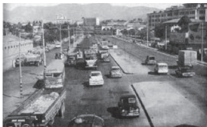
Aspecto das obras finais da duplicação da Avenida Brasil. Ao fundo o Pavilhão de Cursos da Fundação Oswaldo Cruz. DER-DF, 1958. Avenida Brasil na década de 1960.

A Avenida Brasil teve origem num projeto de incentivo à industrialização e à circulação de mercadorias. Dava acesso a uma grande área ainda pouco acessível, favorecendo a implantação de indústrias e viabilizando uma alternativa aos demais tipos de transporte, como os trens, os bondes, os barcos e navios e, também, às vias que interligavam outras partes da cidade. Atendia à lógica de circulação de produtos, ligando o Porto da cidade à zona de Santa Cruz, abrindo caminho para a ocupação por indústrias ao longo da via, e ainda favorecia a nova modalidade de transportes – os automóveis, caminhões etc 60 .