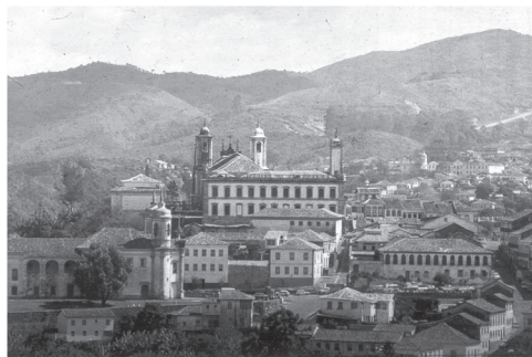
Ouro Preto/MG. 1985.

Constata-se a força desse trabalho no uso incipiente da ideia de referência cultural nas práticas com o patrimônio de natureza material, como os bens arquitetônicos e urbanísticos, embora tal ideia tenha sido adotada pelo IPHAN desde o final da década de 1970. Apenas na lida com o patrimônio de natureza imaterial que a referência cultural vem norteando os trabalhos de forma mais ampla, ficando associada a este tipo de bem, sendo: os saberes, celebrações, modos de fazer e lugares , todos definidos como tipos de bens no Decreto 3551, de 2000, relativo ao Registro de bens como Patrimônio Cultural Brasileiro de Natureza Imaterial. A categoria lugar , que pode ser aplicada aos bens imóveis e urbanísticos, considera para a valoração desses bens seu papel como suportes de práticas culturais coletivas.