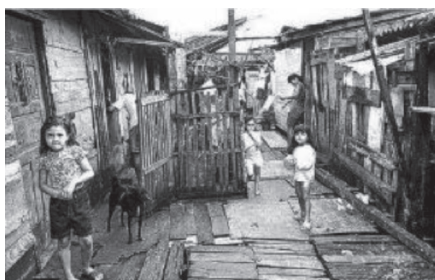
Aspecto da Maré (Wikipidia – Acesso em janeiro 2014)

A valoração da Maré nesse contexto deve considerar a repercussão das ações do governo no Rio de Janeiro, cidade Capital do País, onde se buscava, desde a década de 1930, construir uma imagem exemplar de um Brasil moderno. Lauro Cavalcanti, em seu livro As preocupações do belo , descreve o projeto de modernização do governo do Estado Novo, referindo-se às construções governamentais, cujo objetivo era criar o centro simbólico da cidade. Contextualiza esse fato, utilizando um texto oficial da Revista do Serviço Público , de janeiro de 1939, que diz: