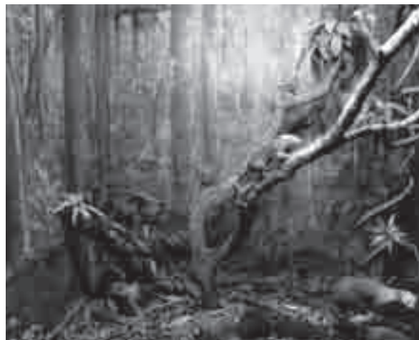
“Floresta com Araucária” – Museu de História Natural do Capão da Imbuia – PR

Tivemos a intenção aqui de apresentar um pouco da história e do potencial educativo dos dioramas, um objeto expositivo que vem sendo utilizado ao longo do tempo pelos museus de ciências. Para além de representar um ambiente, a capacidade dos dioramas em transpor o observador para o local ali reproduzido pode estar em uma das peculiaridades desses objetos expositivos que é a de convergir o conhecimento científico com o artístico. Essa associação é um forte indício de que os dioramas foram concebidos com propósitos educativos.