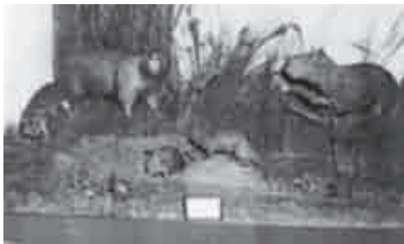
Diorama apresentado na exposição inaugural do novo edifício do Museu de Zoologia.

A ambientação dos animais, a sua contextualização nas exposições, consistia em um dos aspectos principais na concepção de Olivério para os museus de história natural. Além de ser herdeiro da tradição dos naturalistas que aqui estiveram, ele era um pesquisador que realizou inúmeras expedições científicas, levando em consideração a visão do conjunto ambiental como fundamental para a compreensão da zoologia. Essas ideias passaram a ter caráter normativo, ao definir as finalidades da instituição: