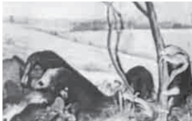
Diorama apresentado na exposição inaugural do novo edifício do Museu de Zoologia.

mais mantinham nos ambientes naturais, a grande popularidade que os dioramas adquiriram com as exposições do Museu de História Natural de Nova Iorque e a nova proposta arquitetônica do espaço expositivo. Como não foram encontrados registros de profissionais especializados atuando exclusivamente nas exposições daquele período, consideramos que os diretores eram os responsáveis pelo planejamento, pela montagem e pelo uso dos espaços expositivos.