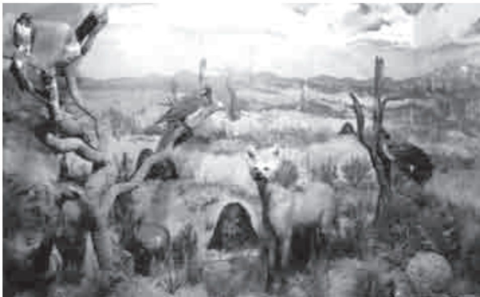
“Cerrado” – Museu de História Natural do Capão da Imbuia – PR

como os dioramas são ferramentas úteis para o ensino: