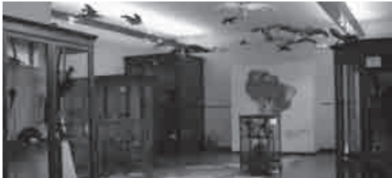
Museu de Zoologia - USP

No trabalho realizado, foram consideradas como categorias de análise das abordagens os aspectos: taxonômicos, evolutivos, biogeográficos, so-