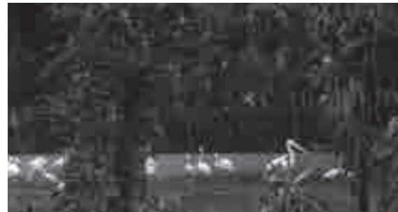
Zoológico Quinzinho de Barros