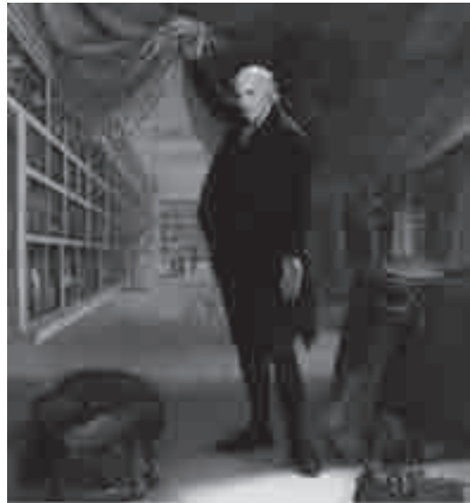
O artista em seu museu — auto-retrato. Charles Willson Peale, 1822.

Essa estética está absolutamente inserida no mundo moderno, ao mesmo tempo em que reforça os aspectos culturais historicamente constituídos (ARGAN, 2001). Neste momento histórico, fins do século XVIII, todos os museus modernos tinham essa mesma base matricial: eram cientificamente organizados.