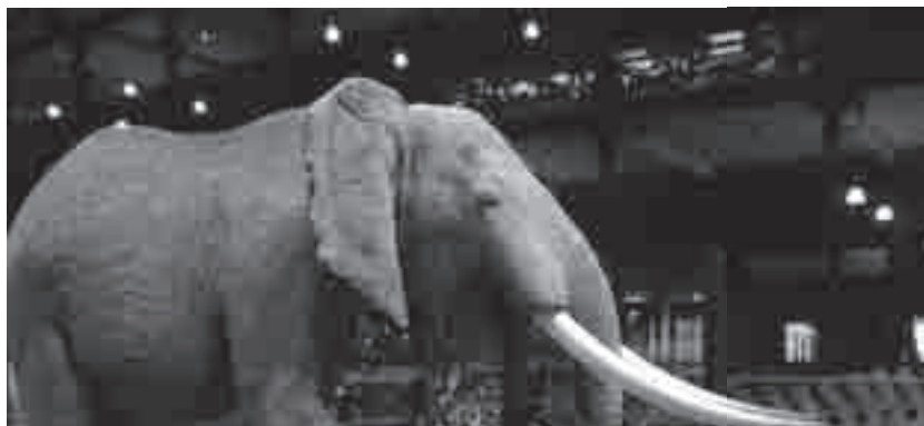
Museu Nacional de História Natural- Paris

estão presentes na exposição da Grande Galeria todas as abordagens de biodiversidade por nós propostas. A preocupação em exibir a variedade de espécie, a genética e a de ecossistema é forte, assim como a intenção de trabalhar as dimensões de tempo e espaço na distribuição dos organismos. A questão evolutiva é central na exposição, quando as relações de ancestralidade são tratadas, por exemplo, com os fósseis.