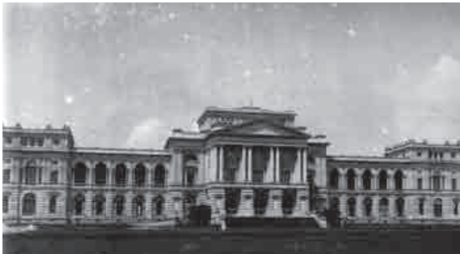
Museu de História Natural - Paris

museológicas na formação de uma Cultura Visual (BARBUY, 2006), que tem sua raiz no século XVIII, mas que se consolidou no século XIX. As Exposições Universais, que atravessaram todo o século XIX, também fazem parte desse caldeirão cultural, responsável pela construção de uma educação visual, pelos novos modos de ver e por novas possibilidades experimentais visuais. A organização espacial deixou de ser ocasional para se tornar