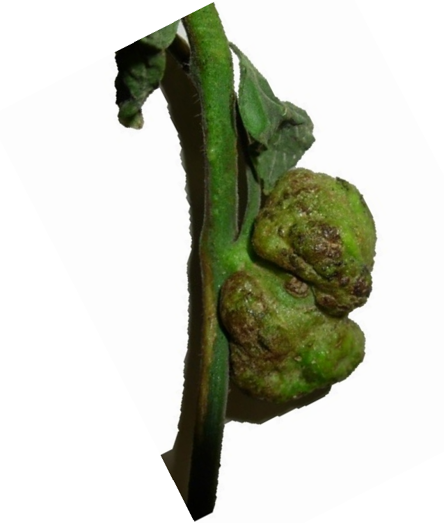
Galha em tomateiro Agrobacterium