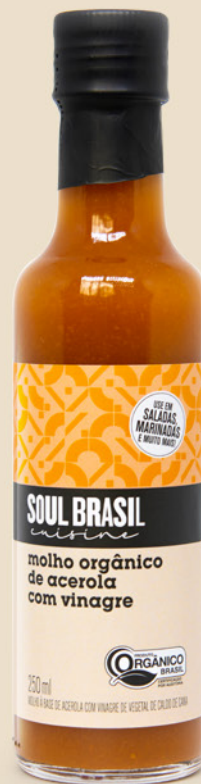
Molho com Acerola e Vinagre - ORGÂNICO