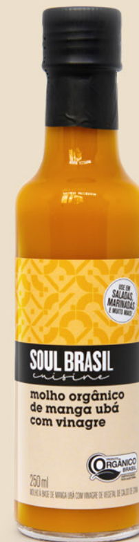
Molho com Manga Ubá e Vinagre - ORGÂNICO