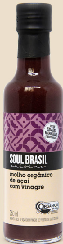
Molho com Açaí e Vinagre - ORGÂNICO

Condimento à base de frutas com vinagre, receita de inspiração francesa, mas usando as frutas brasileiras. Versátil, bom para temperar salada, mas melhor ainda se usado para cozinhar, marinar, servir como caldas e molhos.