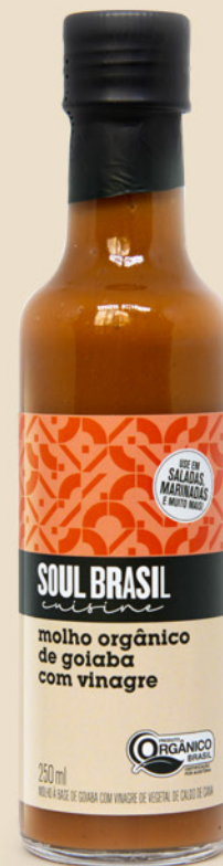
Molho com Goiaba e Vinagre - ORGÂNICO