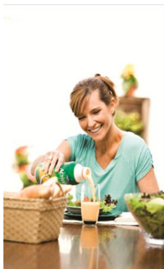
Activia com Suco, identificado no Estudo de Hábitos e Atitudes como oportunidade de acompanhar refeições leves.

Foi com base na atualização desse tipo de estudo que a Danone identificou os momentos ao longo do dia em que Activia era consumido e verificou que havia oportunidades para ampliar tais ocasiões de consumo como acompanhamento de refeições e como sobremesas. A partir daí, o time de Desenvolvimento de Produto passou a trabalhar em duas opções de produto: o Activia com Suco, para acompanhar refeições leves, e o Activia Frozen, produto desenvolvido para ser consumido como sobremesa.