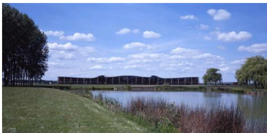
Centro de Pesquisas Daniel Carasso, Palaiseau, Paris, França, 2004