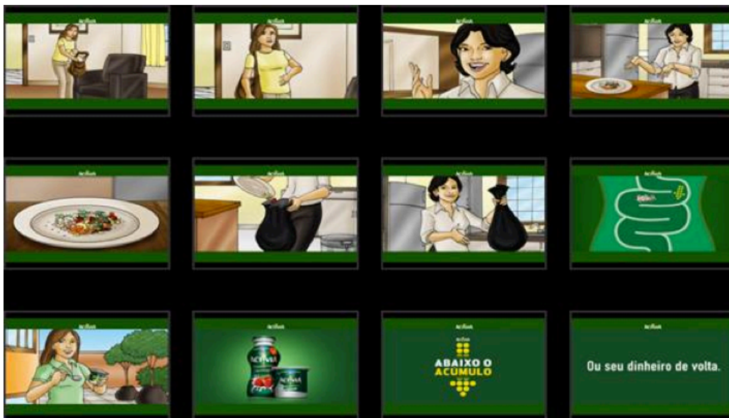
Story-board do filme “Resíduos”, assim como foi testado, em agosto de 2009

construção de uma marca: a mobilização, que mede o quanto o filme mobiliza efetivamente o consumidor para efetuar uma compra, e o índice de recall , que verifica o impacto que uma peça pode causar ao chamar a atenção de potenciais consumidores em meio a uma variada gama de filmes publicitários que são veiculados nos intervalos comerciais. Para que um filme vá ao ar, é primordial que ele tenha tido um bom desempenho nesses dois quesitos.