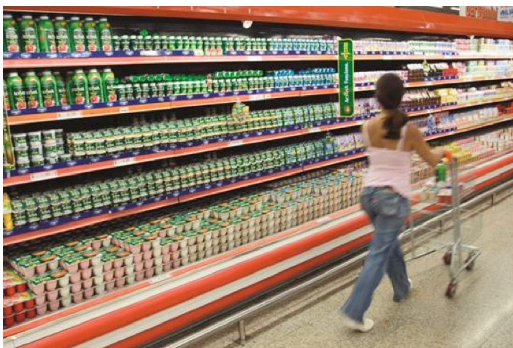
Consumidora em frente ao “paredão verde” de Actívia, em loja de São Paulo

Uma das principais mudanças geradas nesse comportamento, cujo potencial foi identificado nos estudos de Shopper , foi a criação do “paredão verde”, exposição blocada de todos os produtos Actívia, que inaugurou o segmento de funcionais nos mais variados tamanhos e estilos de pontos de venda. Essa exposição “verde”, uma referência à cor da embalagem da marca, permitiu que grande parte dos consumidores passasse a identificar com facilidade a marca e suas cerca de 40 opções, numa gôndola que expõe cerca de 600 skus 2 num mercado de PLF 3 composto nacionalmente por mais de 2.000 skus.