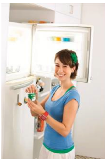
Activia Frozen, para ser consumido como Sobremesa

Além de todos os aspectos já analisados, relativos ao comportamento de consumo do produto, há outro pilar fundamental, também estudado pelo MRCI , que é a dinâmica existente no ponto de venda. Dentre os conhecimentos gerados sobre o comportamento de compra da categoria, um dos de maior destaque é o de Shopper Behaviour Study , estudo que permite identificar a árvore de decisão de uma categoria.