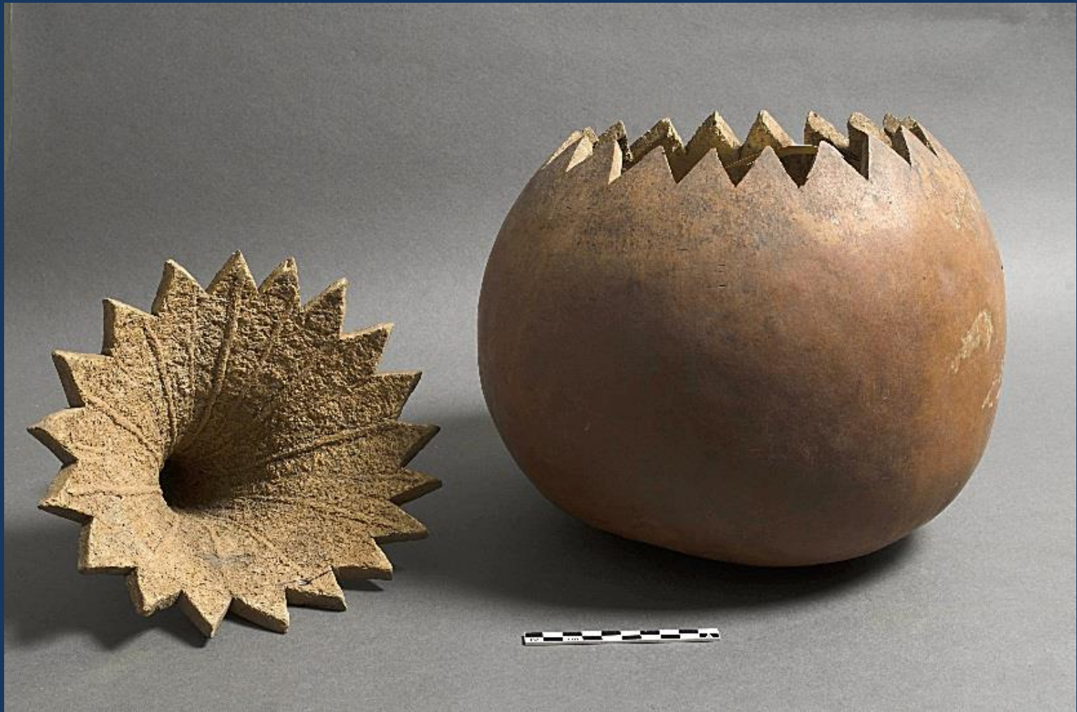
Cabaça com tampa. Terena. Coleta: 1947 . Coleção: Herbert Baldus. Local: P. I. Araribá, SP. Acervo: MAE – USP.