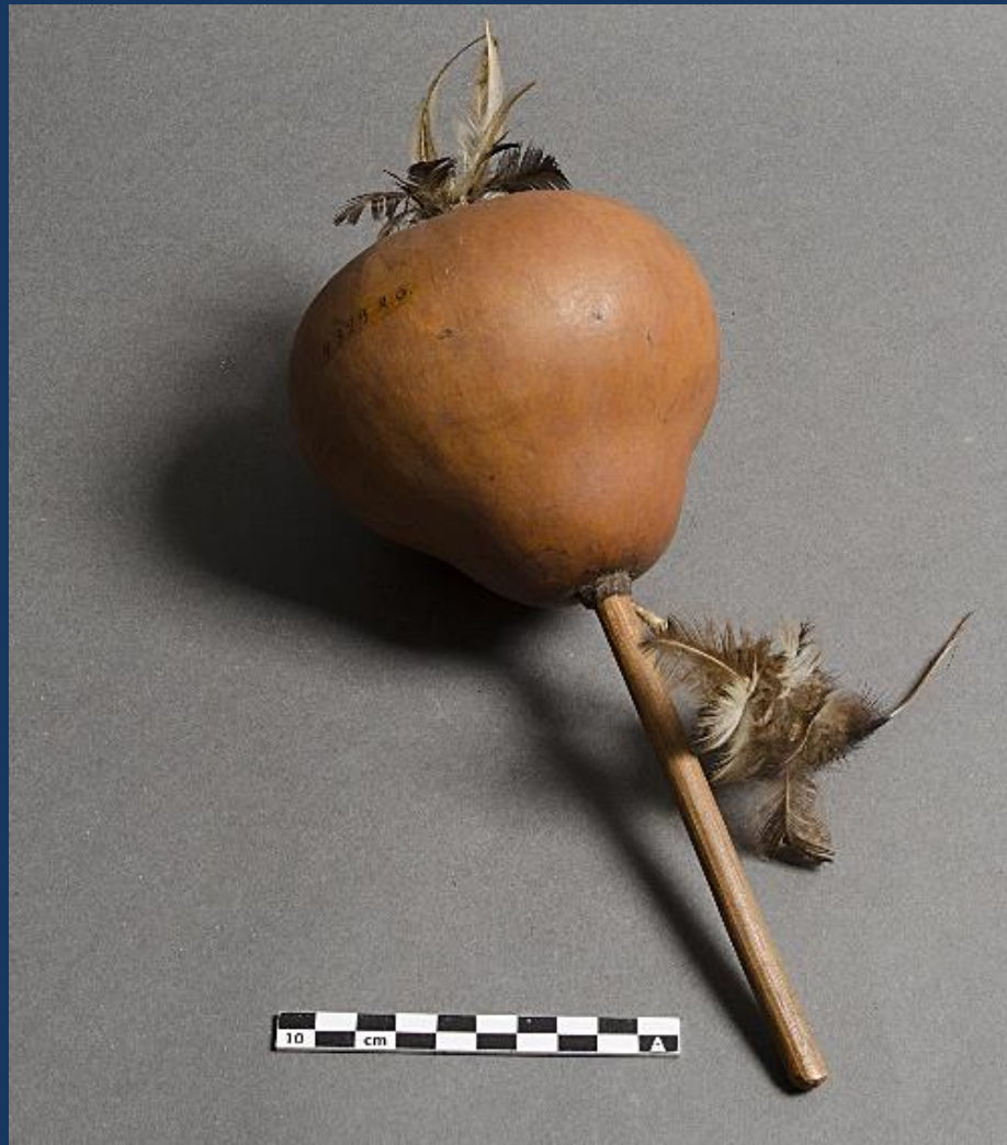
Chocalho. Guarani – Apapokuva. Coleta: entre Abril e agosto de 1947. Coleção: Herbert Baldus. Local: Posto Curt Nimuendaju (antigo Araribá). Acervo: MAE – USP.