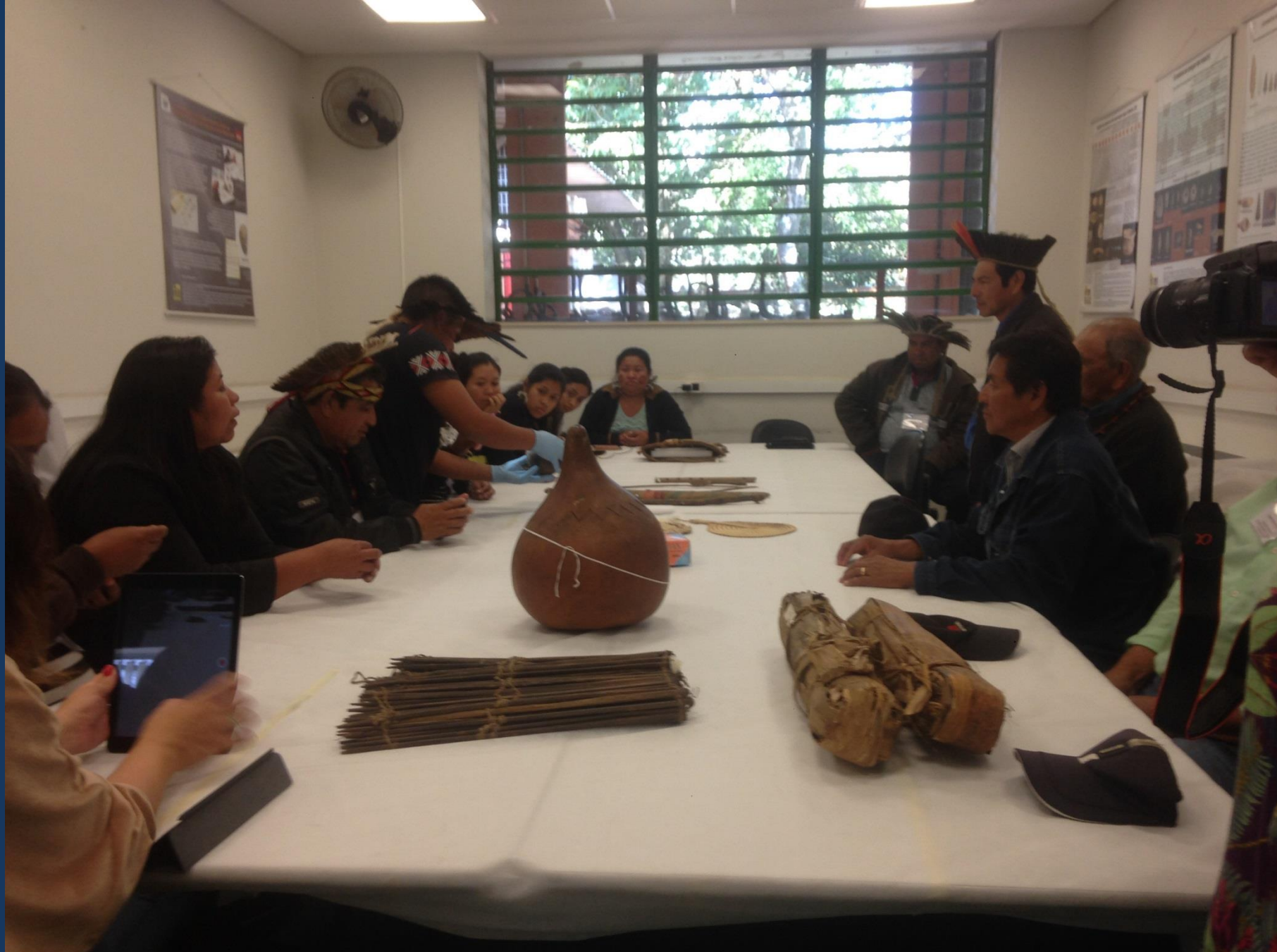
Requalificação do acervo.