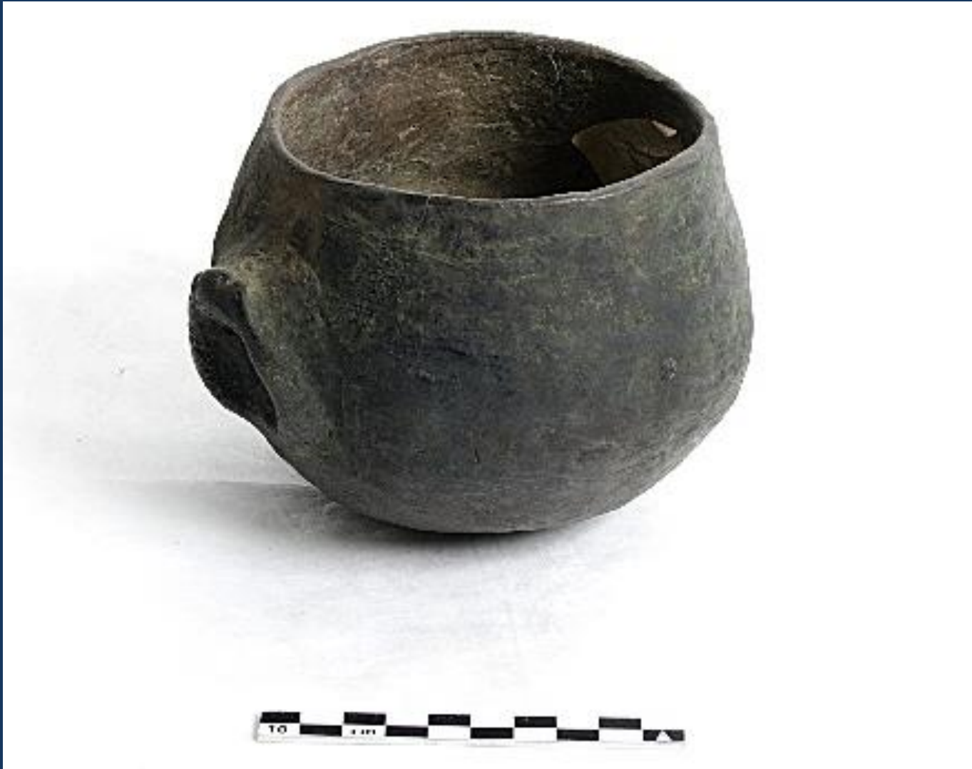
Panela. Kaingang. Coleta: 1947. Coleção: Hebert Baldus. Acervo: MAE – USP .Foto: Ader Gotardo