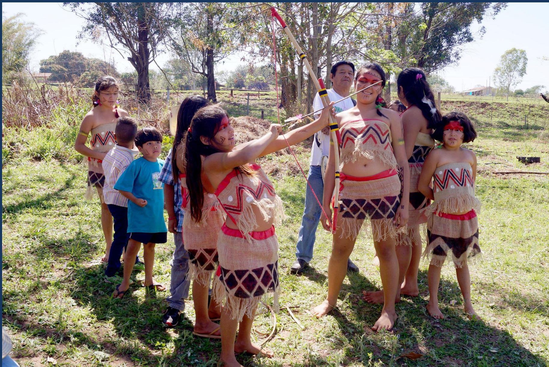
Estudantes da Aldeia Icatu – Kaingang e Terena.