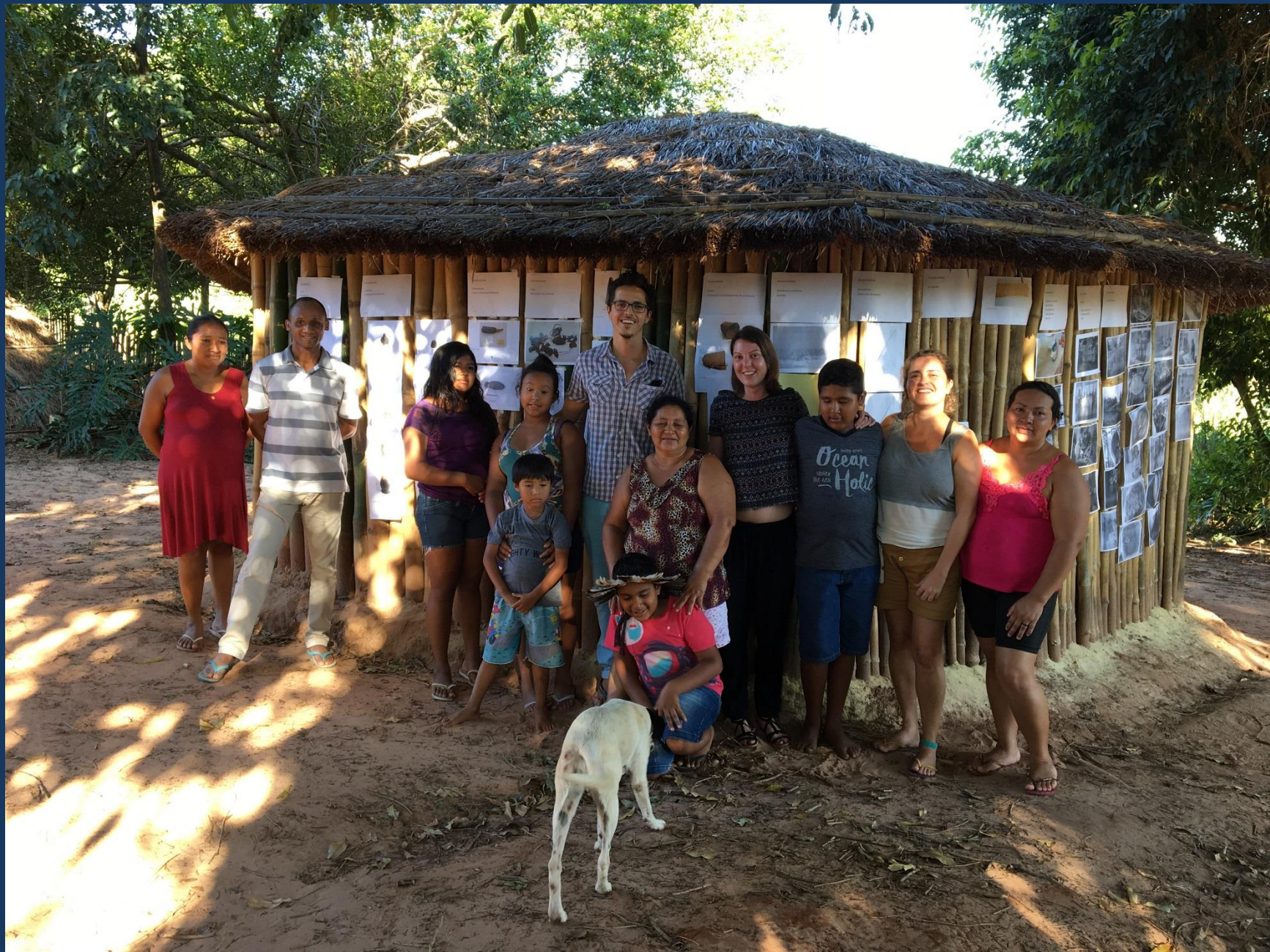
Aldeia Vanuíre, Museu Worikg– Kaingang.