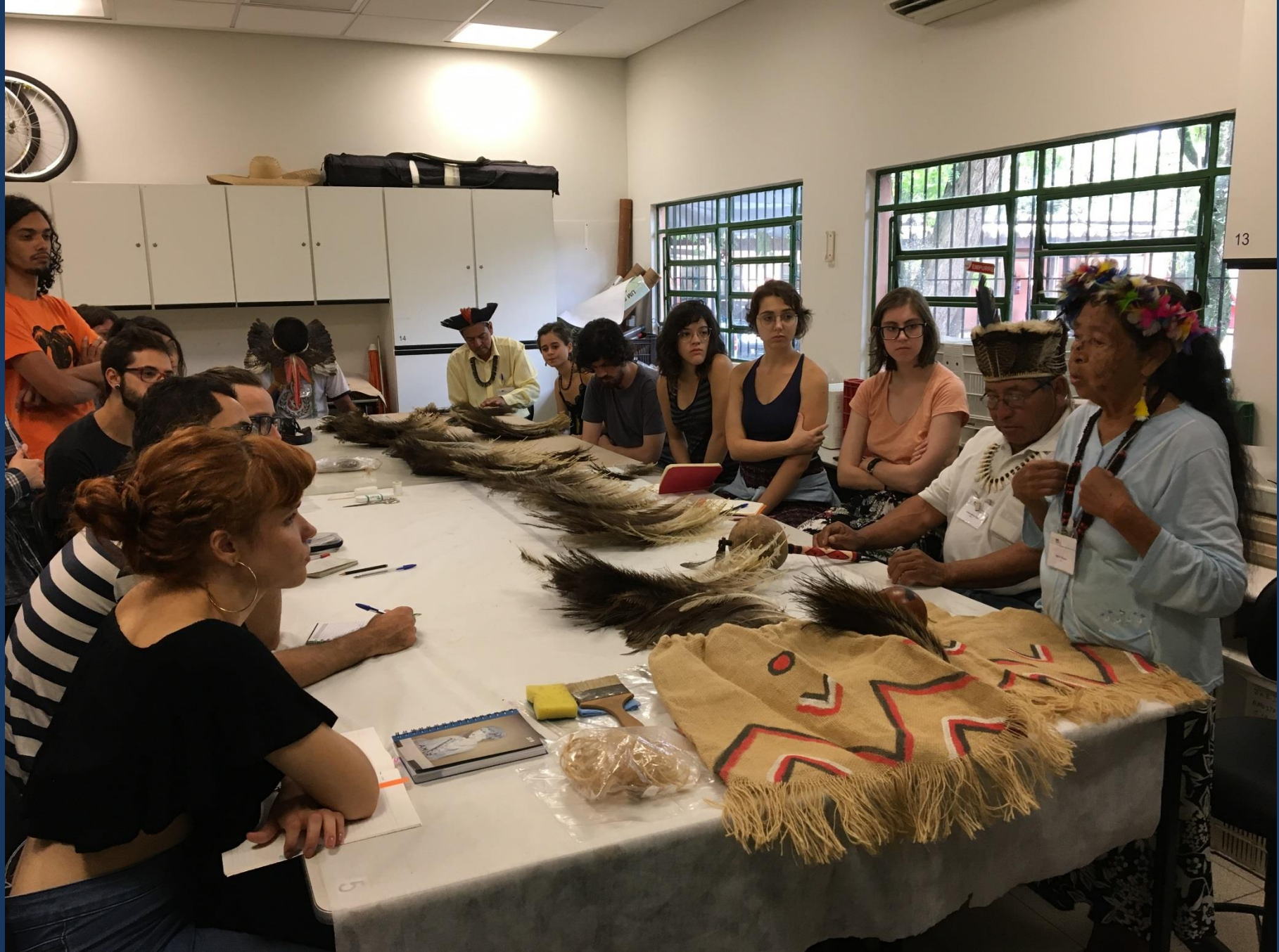
Restauo da vestimenta da Ema.