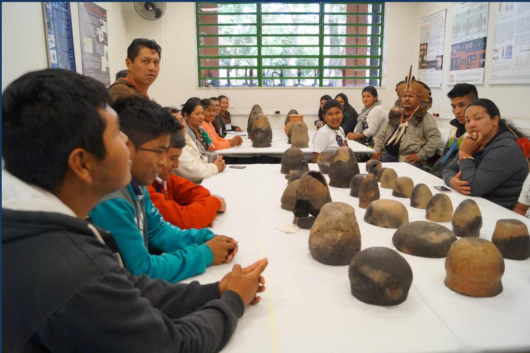
Requalificação do acervo.